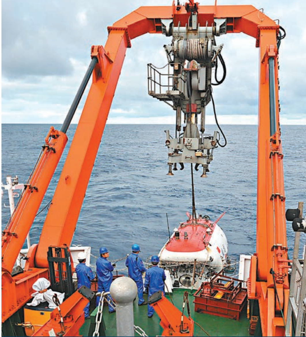
■中國載人潛水器「蛟龍」首次西南印度洋中國多金屬硫化物勘探合同區下潛執行科考任務。

這次下潛的主要任務是繼續對潛水器各系統功能覆核，採集海底熱液區岩石、硫化物或氧化物樣本，開展底層沉積物和底層水採集及地熱測量，測定環境參數，擇機觀測並採集生物樣品。如發現活動熱液區，採集「煙囪」樣本並測量溫度等。