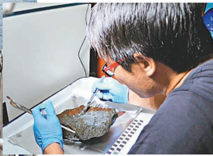
■科考隊員從「蛟龍」號採集到的硫化物樣本上提取微生物。資料圖片