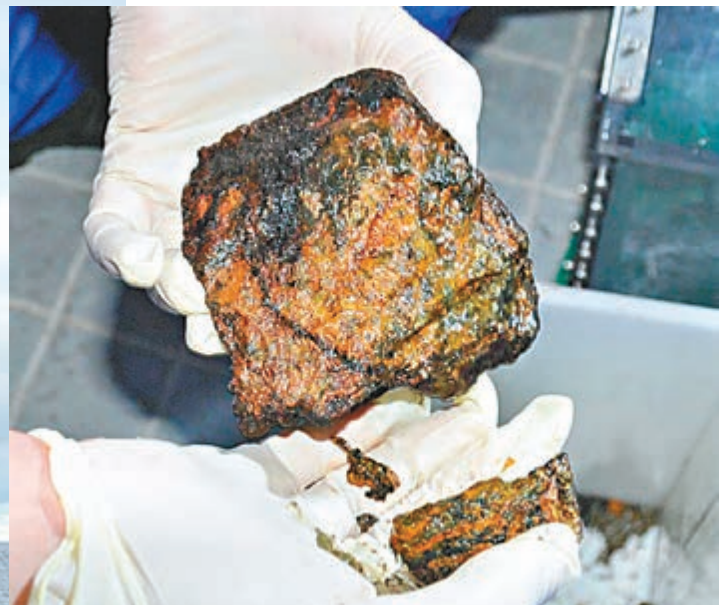
■「蛟龍」上月26日採集到的海底硫化物樣品。資料圖片