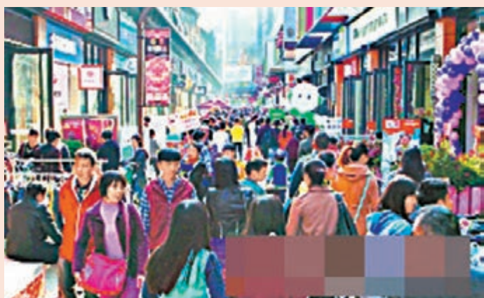
■廣州許多市民元旦日出門逛街購物。

香港文匯報訊 據《南方日報》報道，廣州市內商家迎來了新年「開門紅」。內地元旦小長期首日廣州零售總額超過億元，商家們有望過個大肥年。