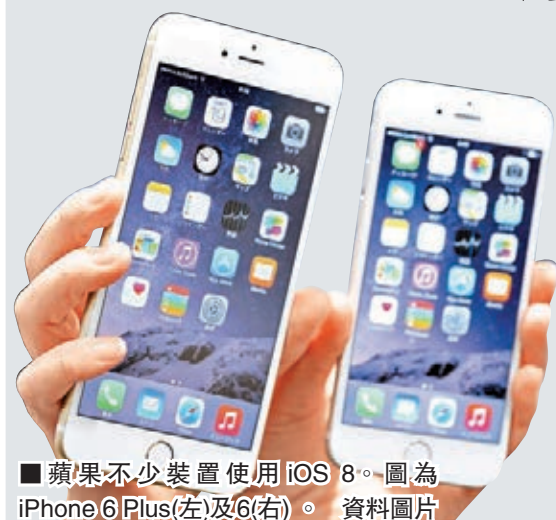
蘋果不少裝置使用 iOS 8。圖為 iPhone 6 Plus(左)及 6(右)。

智能裝置製造商在宣傳產品時，慣常不會標示預載程式和作業系統已佔據的儲存空間，意味用戶實際可用空間往往較宣傳少一大截。兩名美國居民周二入稟加州聖何塞聯邦法院，控告蘋果公司在宣傳 iPhone、iPod 與 iPad 的儲存空間時存在不公平誤導，包括未有預先告知消費者最新操作系統 iOS 8 可霸佔多達 23% 儲存空間，向蘋果發起集體訴訟，索償至少 500 萬美元(約 3,880 萬港元)。