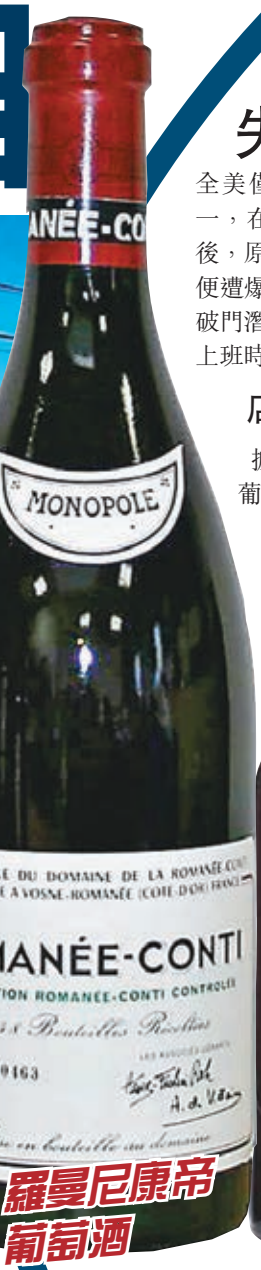
羅曼尼康帝葡萄酒