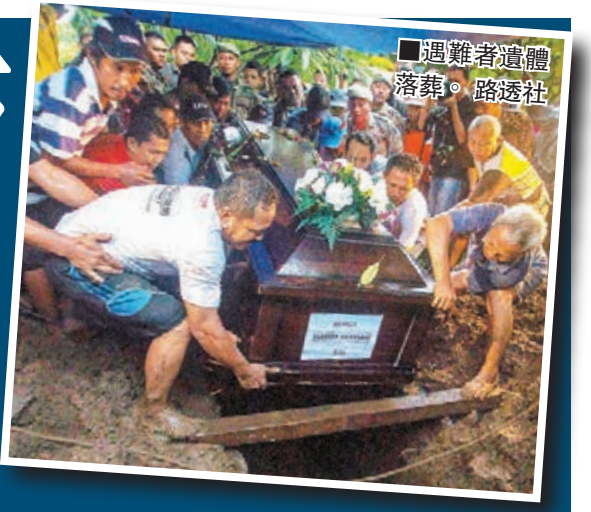
遇難者遺體落葬。