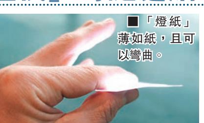
「燈紙」薄如紙，且可以彎曲。

科技不斷推陳出新，電燈泡可能即將成為歷史，美國科企 Rohinni 突破發光技術，把微型 LED 燈泡打印在薄如紙的導電層上，不僅可貼在牆上，甚至任何物件的表面均可轉化成燈，未來對「電燈泡」的認識或將不再一樣。