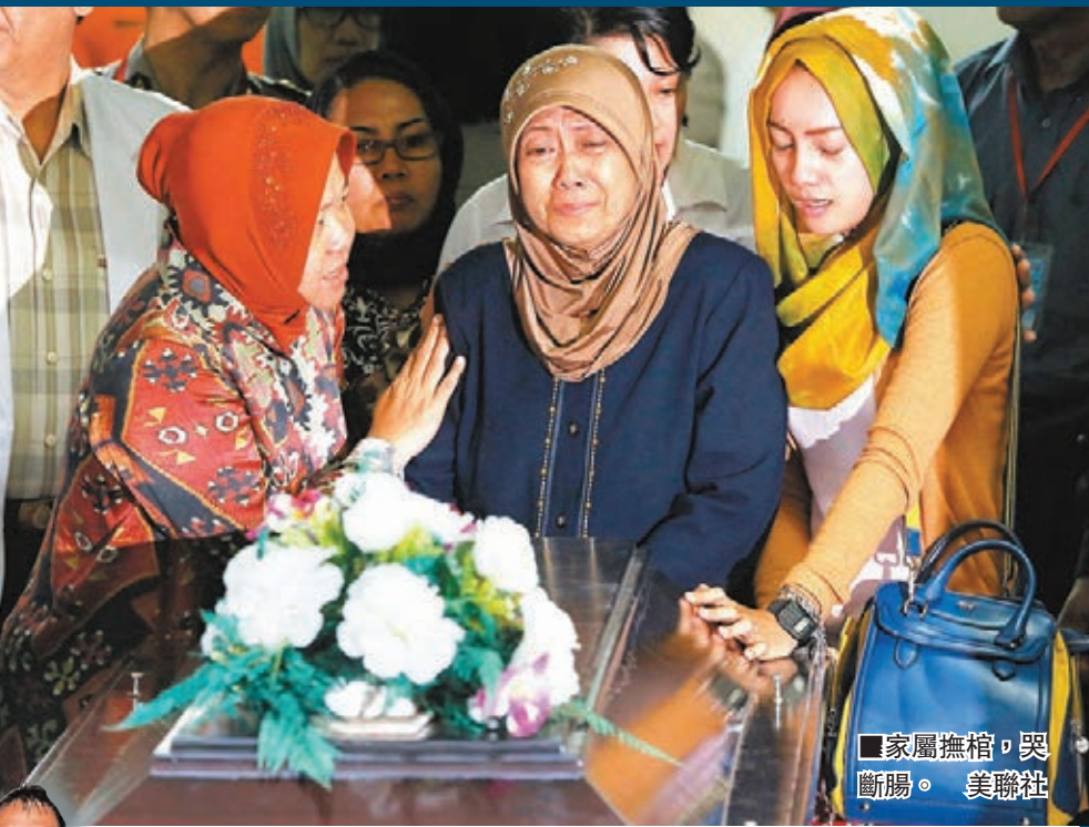
家屬撫棺，哭斷腸。