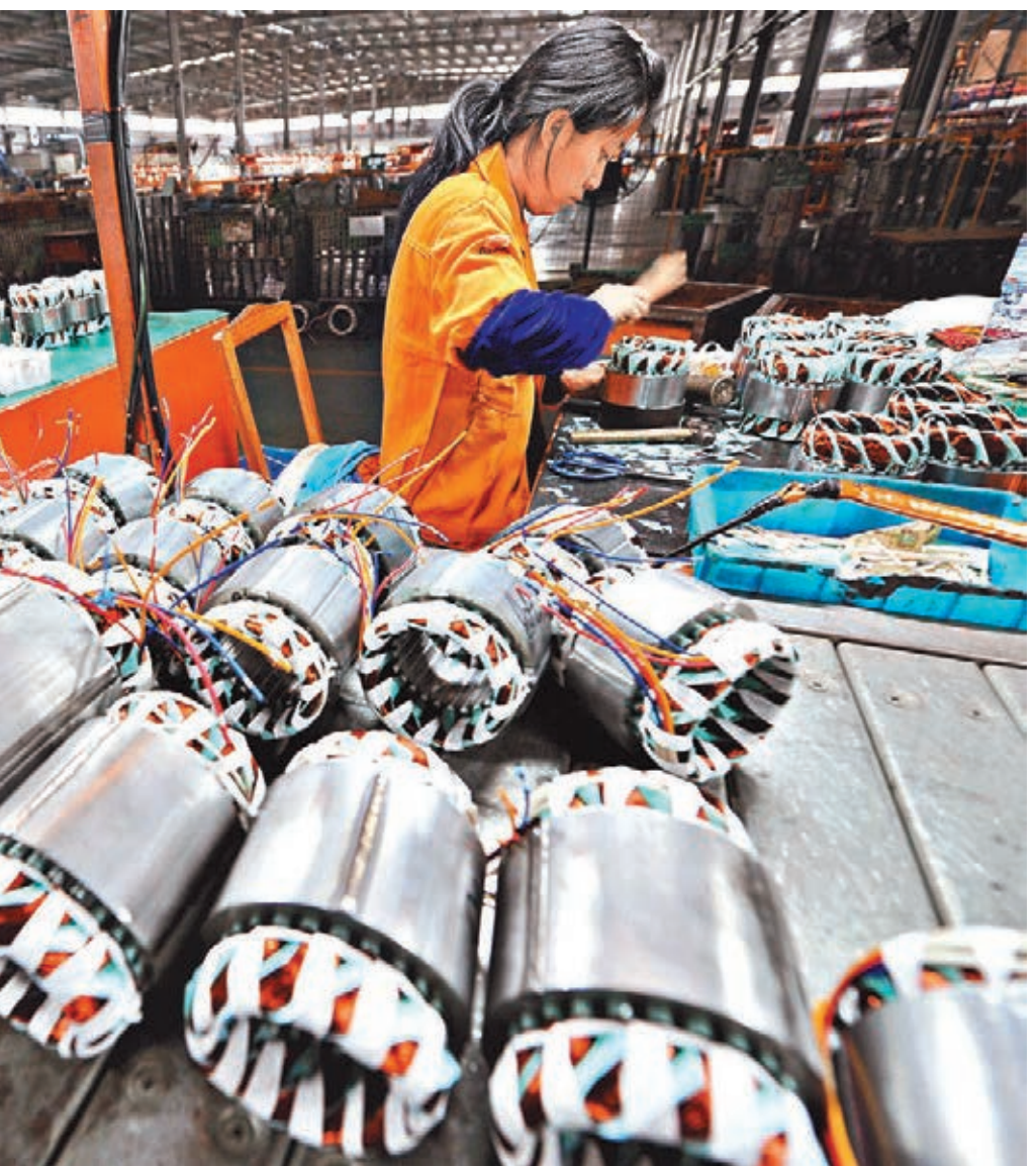
■2014年12月份內地製造業PMI為50.1%,是18個月來最低點。圖為福建一家電機廠生產線。