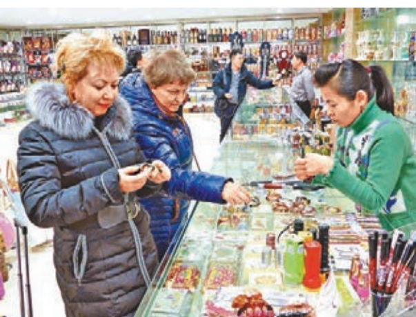
■俄羅斯遊客在琿春購物。

據知情人介紹,盧布的貶值,對中俄的邊貿影響並不是很大,但是對於琿春的對俄貿易零售業還是有較大影響的。盧布貶值後,來琿春的俄羅斯人相對減少,且消費能力降低,致使琿春的對俄零售業銷售額銳減,有些店面難以維持,有些不得不免稅或關閉。為了消解盧布貶值對零售業的影響,當地政府採取了一系列措施,如給來琿春旅遊的俄羅斯遊客發購物券,實際上在一定意義上抵銷和減緩金融波動給旅遊業帶來的壓力,同時也幫助了前來消費