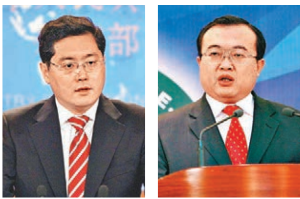
■秦剛。 資料圖片 ■劉建超。

中國外交部下設二十九個司局級單位,最新一輪司局級人事更迭目前尚未完全結束。外交部網站顯示,目前外交部幹部司司長和歐亞司司長兩個職位仍然空缺。外交部及駐外使館網站報道顯示,日前,外交部原幹部