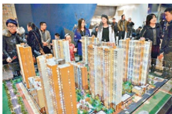
■社科院的研究預計,兩年內會有30%-40%的房企遭到淘汰。圖為內地一個房地產展銷會。

香港文匯報訊(記者 馬琳 北京報道) 中國指數研究院1日發布數據顯示,2014年內地共有80家房地產企業躋身百億軍團,較2013年增加9家,銷售總額共計2.8萬億元(人民幣,下同),市場份額已近40%。市場分析認為,在當前房地產市場下行趨勢明顯的情況下,房企強者恆強的態勢愈加凸顯,中小房企未來的生存空間被擠壓,房地產市場或將迎來寡頭時代。 中國指數研究院認為,優秀的百億房企憑借更加靈活的適應能力和更高的抗風險能力,在急轉直下的市場環境中經受住了來自政策、去化、資金等各方面的多重考驗。從銷售業績分布來看,百億房企分化出三大陣營:第一陣營囊括7家千億級企業,綠地、萬科雙雙邁入2,000億元門檻,平均38%的業績增幅進一步拉大與其他千億企業的距離;第二陣營為12家300億-1000億元企業;而100億-300億元企業最為集中,共計61家,競爭尤為激烈。