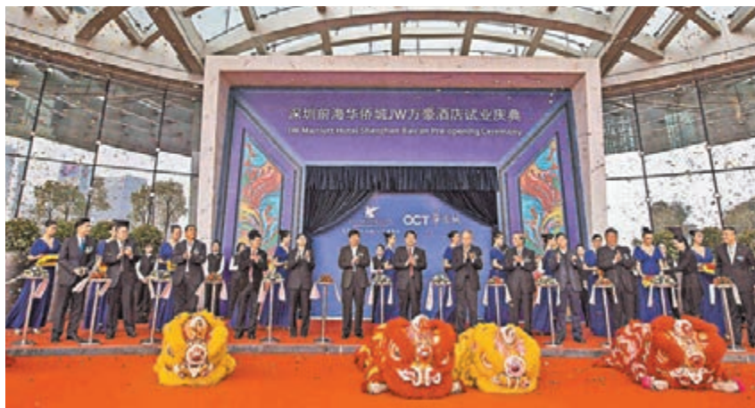
■深圳前海片區內首家白金五星級酒店——深圳前海華僑城JW萬豪酒店日前試業。

與華僑城其他成功酒店一樣，前海華僑城JW萬豪酒店頗具文化特色。酒店由世界頂級建築設計師約翰·波特曼和國際著名酒店室內設計公司新加坡H.B.A.共同傾力打造，具有濃郁的現代氣息與海洋文化。其外立面以柔和的弧形線條展現水的柔美，呼應海洋的流動，內飾以吉祥圖騰鳳凰為靈感，對東方文化進行抽象和提煉，將主題文化特色傳統和商務酒店的現代功能全面結合，致力於為商務及休閒旅客呈獻卓越的服務與設施。酒店空間藝術感十足，入口處即為知名藝術家展望先生的雕塑作品《物的天堂》，展現出深圳的秀麗