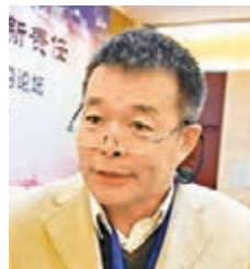
■清華大學國情研究院院長胡鞍鋼。