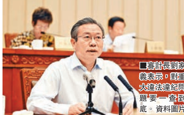
審計長劉家義表示,對重大違法違紀問題要一查到底。資料圖片

香港文匯報訊 中國審計署審計長劉家義昨日在北京表示,當前反腐倡廉的形勢與任務仍然非常艱巨,新形勢下國家審計工作一項重要任務就是要把反腐倡廉建設貫徹始終,對重大違法違紀問題要一查到底,查原因、查責任、查後果,推動建立完善「不敢腐」、「不能腐」的制度機制。