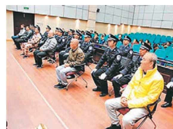
庭審現場。

南通市中級人民法院介紹,庭審和判決過程,全程提供了韓文、日文兩種文字的翻譯,韓國和日本領事也全