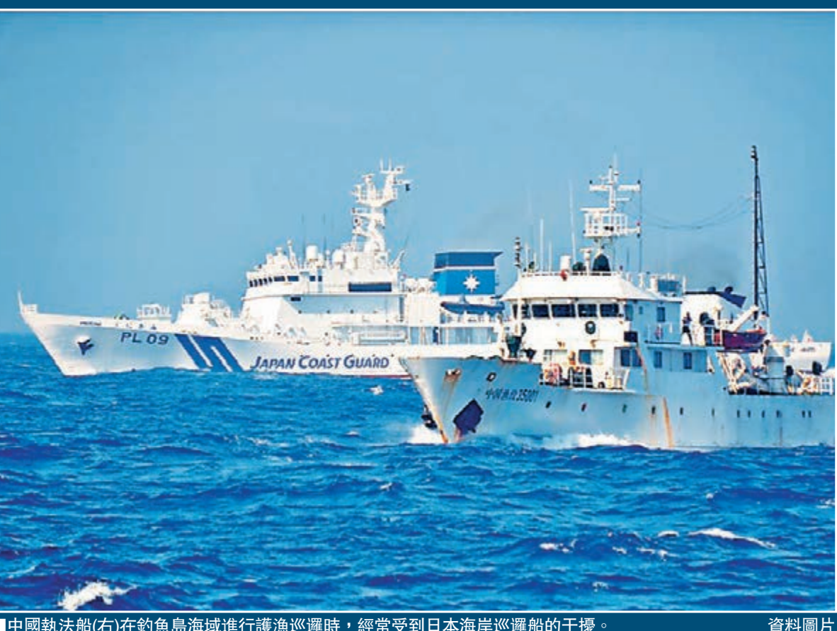
中國執法船(右)在釣魚島海域進行護漁巡邏時,經常受到日本海岸巡邏船的干擾。

中日因釣魚島爭端持續對立,兩國關係在谷底徘徊。日本共同社27日報道指,日本安倍政府明年將盡全力避免圍繞釣魚島發生中日對立。這是因為中日艦機一旦發生不測事態,就將導致中日關係陷入危機。報道引述日本政府多名消息人士指,日方希望在1月舉行磋商以啓動緊急情況下進行相互聯絡的海上聯絡機制。