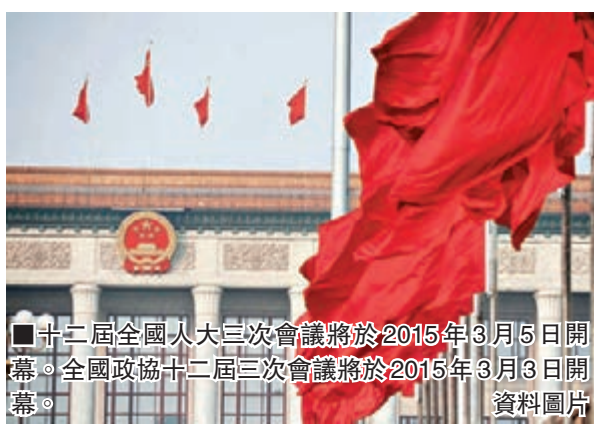
十二屆全國人大三次會議將於2015年3月5日開幕。全國政協十二屆三次會議將於2015年3月3日開幕。資料圖片

另據報道,日前召開的政協十二屆全國委員會第二十三次主席會議,審議通過了關於召開政協十二屆全國委員會第三次會議的決定(草案),建議全國政協十二屆三次會議明年3月3日在北京召開。主席會議決定將決定草案提請政協十二屆九次常委會議審議。