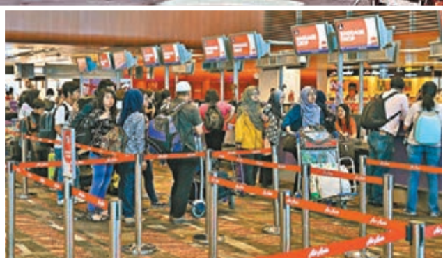
旅客在新加坡樟宜機場的亞航櫃位排隊。

亞洲航空在東南亞各地共有8家分公司, 部分是透過收購其他地區原有航企改組而成。今次出事的QZ8501嚴格上屬於子公司「印尼亞航」(Indonesia AirAsia), 該公司曾因為安全理由在2007年被禁止飛往歐盟, 當時歐盟認為印尼政府對航空業監管不力。