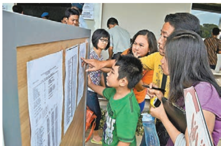
乘客家屬在泗水機場查看乘客清單。

亞洲航空(AirAsia, 簡稱亞航)總部設在馬來西亞首都吉隆坡, 為全球最大廉價航空公司之一, 亦是亞洲首家和最大廉航。今次QZ8501航班事故, 再次引起外界對廉航安全的關注。廉航之所以能提供平價機票, 源於公司盡力減低成本, 包括統一機隊及簡化服務等, 但亦有部分航企會採取減少負載後備燃油、聘用合約員工等具爭議的措施。