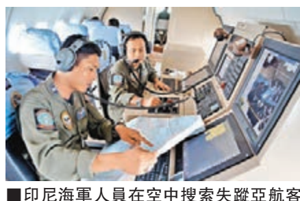
印尼海軍人員在空中搜索失蹤亞航客機。

今年對全球航空業而言是沉重的一年, 根據飛機事故資料庫(BAAA)資料, 連同昨日亞航QZ8501客機失蹤, 今年已發生111宗航空交通意外, 造成逾1,000人死亡。其中牽連最多人數的3宗大型事故均與馬來西亞有關, 包括3月失蹤的馬航MH370及7月在烏克蘭被擊落的馬航MH17, 昨日失聯客機所屬公司亞航亦是以大馬為根據地。