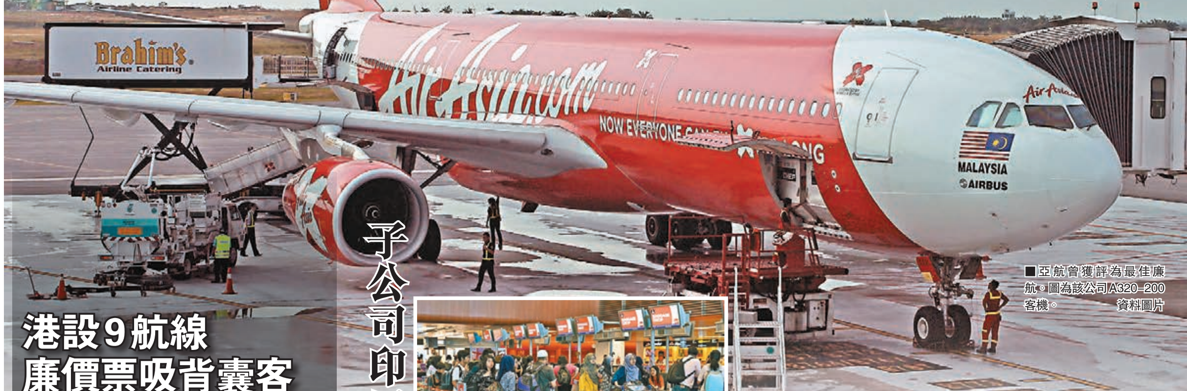
亞航曾獲評為最佳廉航。圖為該公司A320-200客機。