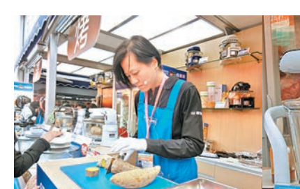
在工展會上專人教授使用光波萬能煮食鍋烤蕃薯