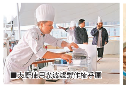
大廚使用光波爐製作梳乎厘