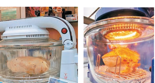
光波萬能煮食鍋可自製燒肉