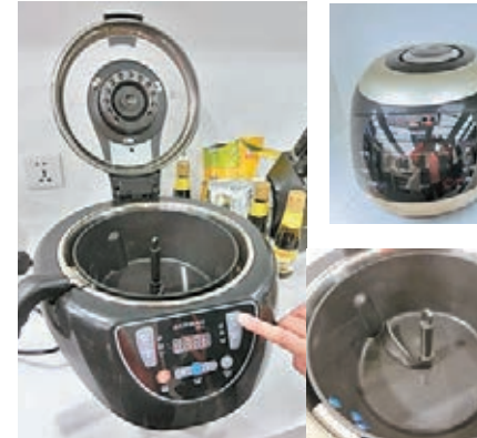
全自動智能電炒鍋，創新一按即炒功能，毋須動手炒煮，適合炒糯米飯。