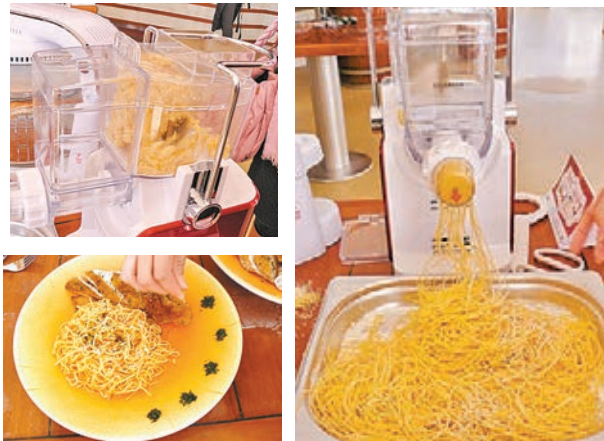
德國寶星級廚師在烹飪班中教授使用德國寶麵條機炮製香草雞扒鮮茄意大利幼麵的方法。