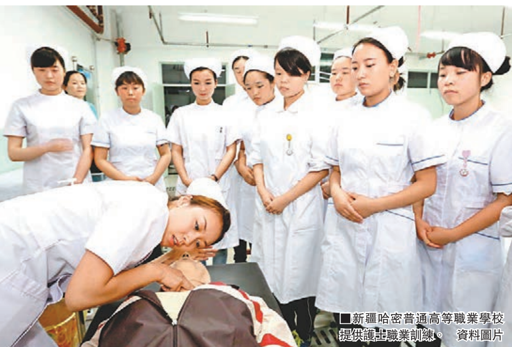
■新疆哈密普通高等職業學校提供護理職業訓練。資料圖片

一邊是高等院校的門被「擠破」，一邊是職業院校四處「討」生源；一邊是數百萬畢業生再逢最難就業季節，一邊卻是企業四處奔波「求賢」……如今，大學畢業的「準白領們」焦急待業，而職業院校的「高級藍領」卻供不應求。是百萬畢業生被現實隔斷了夢想的路？還是高級藍領們用技能開闢出了前行的路？對於很多職業院校來說，這些似乎都不重要。時下，他們最關切的還是生源。儘管近年來國家一再呼籲大力發展職業教育，但中國的職業教育發展，仍然遠遠落後於高等教育和普通教育。