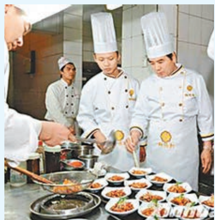
■長垣廚師成為河南重點打造的職業教育品牌之一。

河南省中等職業學校中德合作職業教育教學模式項目研討暨項目評審工作會議日前在鄭州召開，河南省教育廳副廳長尹洪斌指出，要讓德國「雙元制」教育理念在河南落地生根，同時更要發展結合河南實際的職業教育。