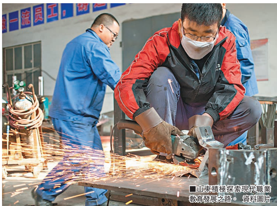
■山東積極探索現代職業教育發展之路。資料圖片