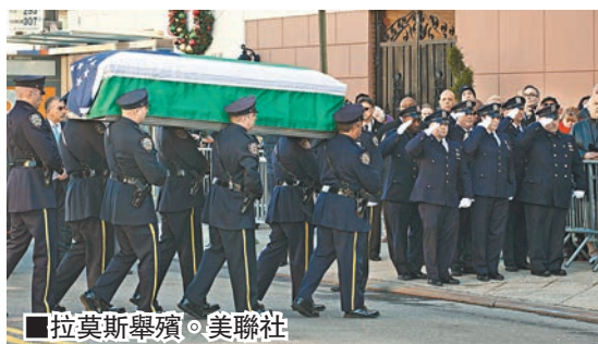
■拉莫斯舉殯。