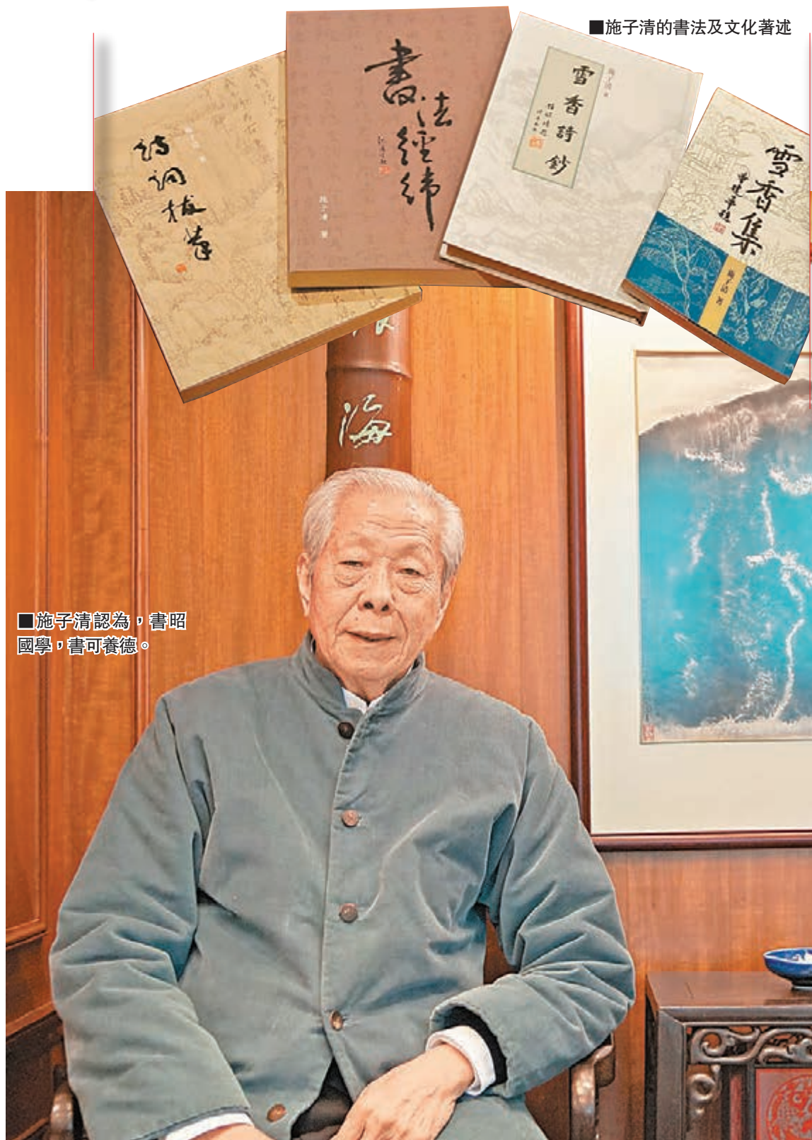
■施子清認為，書昭國學，書可養德。