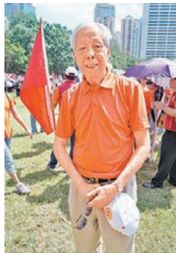
■作為書法界泰斗，施子清一直積極參與本港的各類社會公益活動。