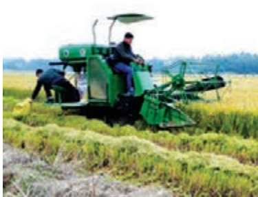
中聯重科農機產品在農田作業。