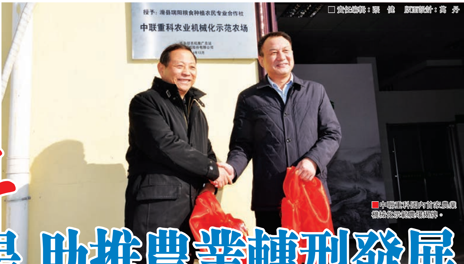
中聯重科國內首家農業機械化示範農場揭牌。