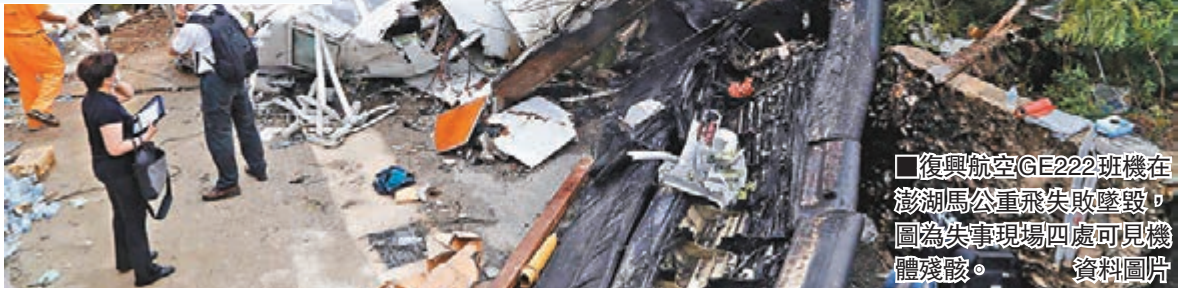
復興航空GE222班機在澎湖馬公重飛失敗墜毀，圖為失事現場四處可見機體殘骸。

上午公布的調查結果顯示，失事班機7時5分44秒解除自動駕駛，7時5分54秒飛機降到176重飛安全高度，誤失進場點，且在7時5分59秒偏離正確航道4度；隨後正駕駛詢問：「看到跑道了嗎？」副駕駛回答「沒有」，兩人重複確認都未看到跑道後，晚了17秒才呼叫重飛。