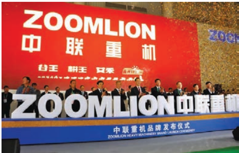
中聯重科農機新品發布。

中聯重科重機公司「谷王」烘乾機擁有國內規模最大的穀物烘乾裝備製造基地，並成立專業研發團隊推動節能環保和智能化技術在烘乾設備領域的應用。「谷王」烘乾機產品涵蓋10-100噸低溫循環式烘乾機、移動式烘乾機、高溫連續式烘乾塔，填補了國內無大噸位低溫循環穀物烘乾機的空白，是目前國內產品種類最為齊全的糧食烘乾裝備品牌。