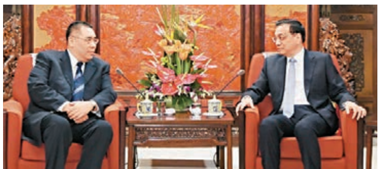
■國務院總理李克強昨會見到北京述職的澳門特區行政長官崔世安。

香港文匯報訊(記者 鄭治祖)國務院總理李克強昨日在中南海紫光閣會見赴京述職的澳門特區行政長官崔世安。李總理表示，澳門特區正處於發展調整的關鍵時期，中央政府會一如既往地支持澳門，並希望新一屆澳門特區政府團結帶領社會各界，抓住新機遇，規劃新藍圖，更加注重社會民生，推動澳門經濟適度多元化，實現經濟社會可持續發展，開拓澳門發展新局面。