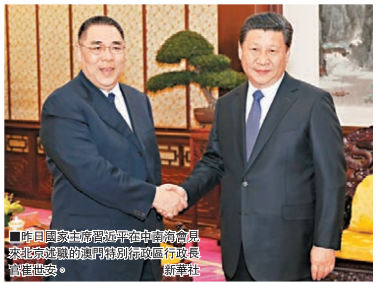
■昨日國家主席習近平在中南海紫光閣會見來北京述職的澳門特別行政區行政長官崔世安。

香港文匯報訊(記者 施虹羽)國家主席習近平昨日在中南海瀛台涵元殿會見赴京述職的澳門特區行政長官崔世安。習主席希望崔世安特首和新一屆政府擔負起責任，增強主人翁意識和憂患意識，努力提高依法行政和依法治國的能力水平，發展經濟、改善民生，推動澳門經濟社會全面發展。