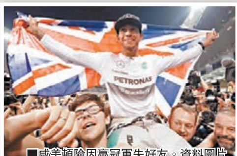
■威美頓險因贏冠軍失好友。資料圖片