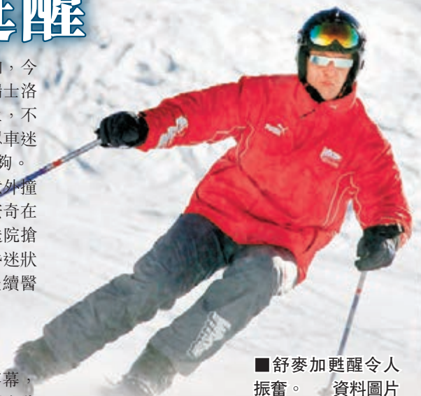
■舒麥加甦醒令人振奋。