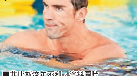
■菲比斯流年不利。資料圖片