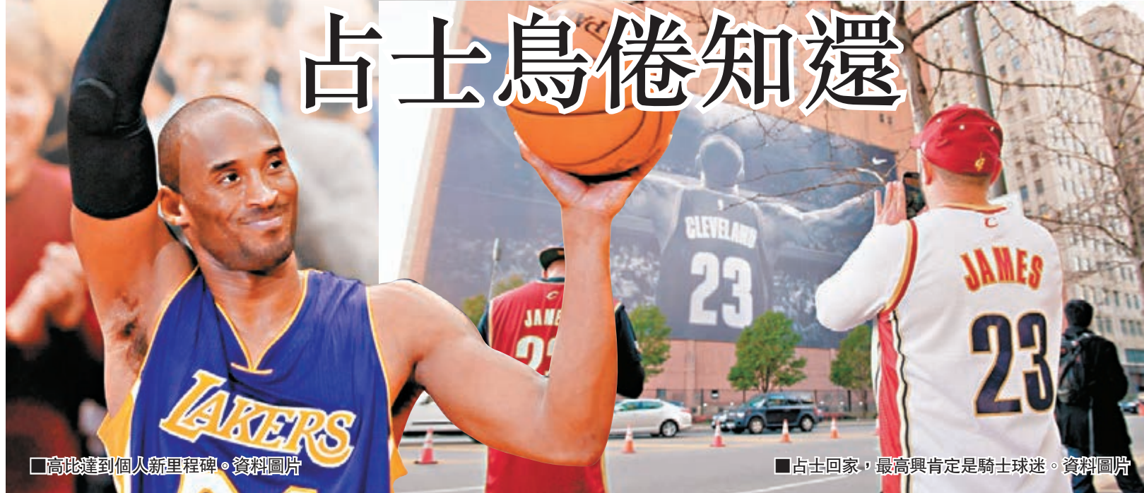
■高比達到個人新里程碑。