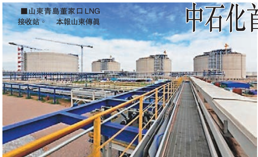
■山東青島董家口LNG接收站。