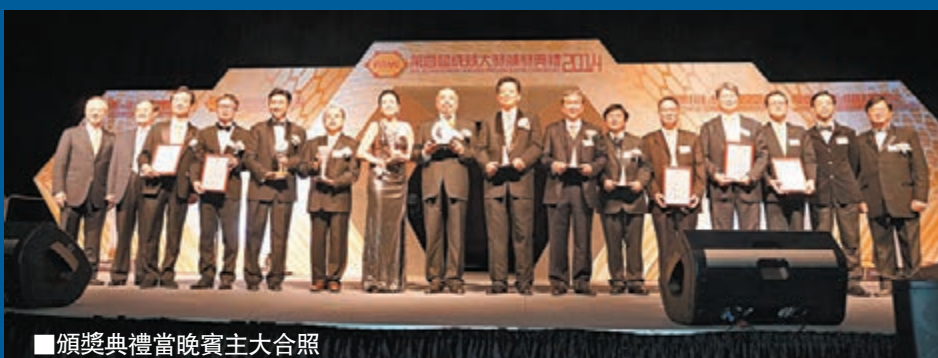
■頒獎典禮當晚賓主大合照

由香港創新科技及製造業聯合總會(FITMI)舉辦的第四屆成就大獎頒獎典禮2014日前假香港亞洲國際博覽館舉行。