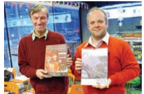
■ 兩位理查德向記者展示《長春通》雜誌。

一位年長高個子，一位年輕很結實，兩位來自英國的理查德，7年前在長春相識。他們雖然年齡不同，身高不同，卻有着共同的夢想，就是讓各國朋友了解長春，熟悉長春，讓世界文化在長春融合。