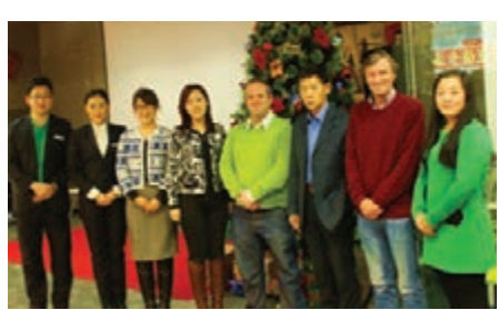
■ 兩位理查德與到訪友人合影。

今年，兩位理查德還和多位熱心的外國專家，義務創辦了《長春通》英文月刊雜誌，他們希望通過《長春通》可以讓外國朋友更加了解長春，了解吉林，甚至是中國的更多信息，讓世界文化在長春融合。他們也希望通過國際友人的眼睛，把美麗長春、魅力吉林的形象傳遞給世界。現在，兩個理查德的中國夢正在逐步實現。