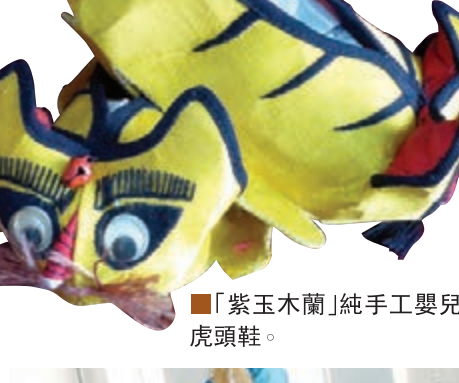
■ 「紫玉蘭」純手工嬰兒虎頭鞋。