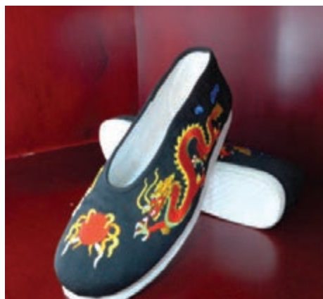
■ 「紫玉蘭」為明星成龍設計的純手工布鞋。