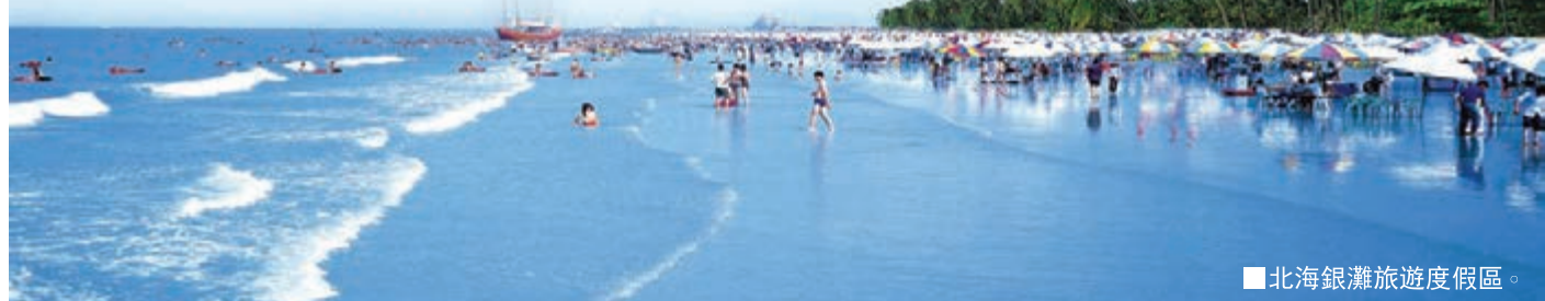
■ 北海銀灘旅遊度假區。