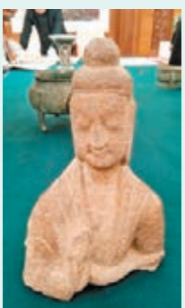
■北魏砂岩半身佛像。