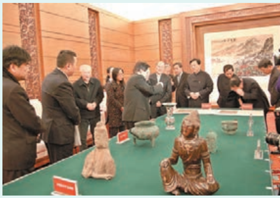
■文物劃撥儀式現場。

香港文匯報訊（記者江鑫網北京報道）國家文物局日前將近年來徵集的商代饕餮紋方彝、南宋夏圭《秋郊歸牧圖》冊頁等11件珍貴文物劃撥中國國家博物館收藏。預計在不久的將來，前往國博參觀的觀眾將可在展廳一睹這批文化遺產的風采。據介紹，是次劃撥的文物包括商代饕餮紋方彝、西周公簋、西周作冊吳盃、春秋戰國虎形玉珮、北魏砂岩半身佛像、宋代褐漆觀音菩薩坐像、南宋夏圭《秋郊歸牧圖》、《柳陰牧笛圖》冊頁、明萬曆款五彩穿花龍出戟花觚、清康熙辛丑款銅胎畫琺瑯花蝶團句杯（2件）等，涉及古代繪畫、瓷器、玉器、青銅器和雕塑造像等門類，為中國商周至明清時期文物珍品，具有很高的歷史、藝術和科學價值。其中，北魏砂岩半身佛像具有雲崗三期（北魏）「秀骨清像」的典型特點，頭、頸、胸、臂保存基本完整，具有較高藝術價值。雲崗石窟流失雕像雖多，但因其砂岩材質極易風化，留存至今的非常少見，且雲崗三期作品目前存世完整者少。這一件文物也彌補了國家博物館藏佛像造像收藏的空白。西周作冊吳盃內底鑄有銘文，6行60字，銘文有損。主要記載了作冊吳參加周王執駒典禮並得到賜駒一事。該盃流嘴較長，流對稱處有一虎首鑿，腹下有三足。國家文物局副局長宋新潮表示，國家文物局一直高度重視流散文物的徵集和保護工作，近年來在中央財政的大力支持下，通過規範運作，徵集了一批各類別文物。是次劃撥國家博物館的11件文物，是歷年徵集文物中的精品。相信這批文物能在國家博物館中得到很好的保護和展示，國博應是這批曾經流散漂泊的文化遺產的「最佳歸宿」。