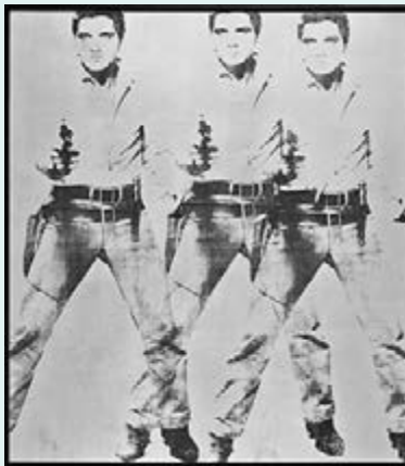
■Andy Warhol's《Triple Elvis (Ferus Type)》

元。2011年，張大千和齊白石等現代藝術家就佔到了全球市場的4%-5%。然而，2014年，這兩位藝術家卻沒能再次一鳴驚人，其業績遠遠落後於三年前。此外，他們也很難抵擋美國著名藝術家的主導優勢，尤其是美國市場上穩坐江山的安迪·沃霍爾。沃霍爾的價格一直處在巔峰。在11月舉行的拍賣會上，他憑借二十世紀偶像人物貓王、瑪麗蓮·夢露、馬龍·白蘭度、伊麗莎白·泰勒的畫作在拍場上佔據了主導地位。這些作品從某種程度講，已經成為當代的蒙娜麗莎。2014年11月12日，佳士得拍賣行分別以7,300萬美元和6,200萬美元的落槌價拍出了沃霍爾的《Triple Elvis (Ferus Type)》（含手續費為8,192.5萬美元）和《Four Marlons》（含手續費6,960.5萬美元）。在最近紐約的拍賣會上，1億美元大關（含手續費）被再次突破：阿爾貝托·賈科梅（Alberto GIACOMETTI）的雕塑作品《Le Chariot》差一點就創下藝術家的個人新紀錄。這一作品落槌價為9,000萬美元，含手續費為1.009億