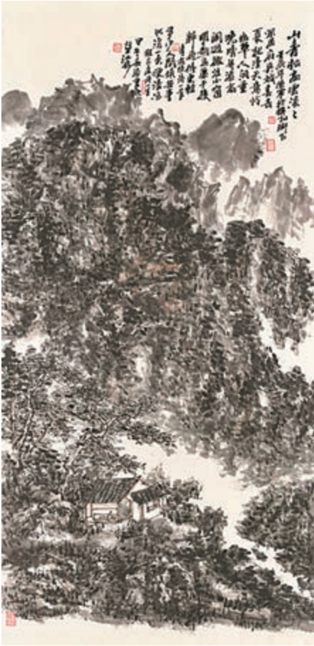
■陳軍作品：《古剎幽境》138 x 68cm