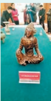
■宋代褐漆觀音菩薩坐像。