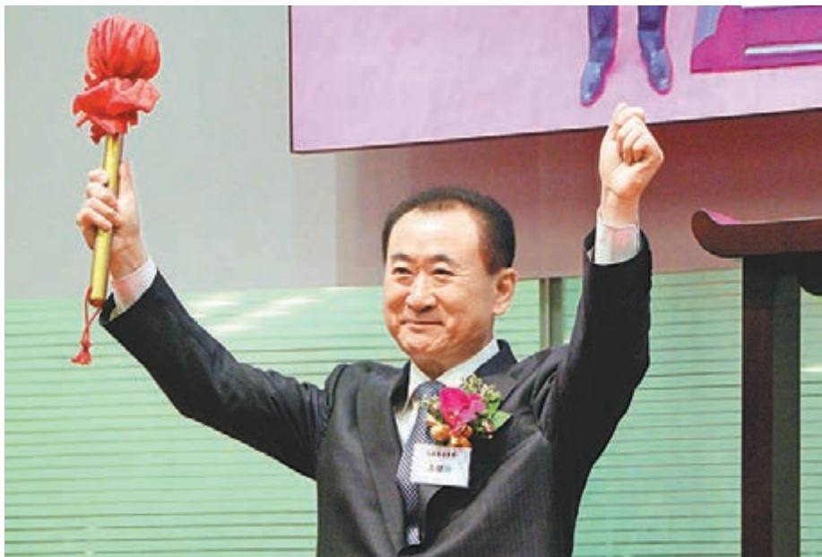
大連萬達商業地產創始人、董事長王健林。