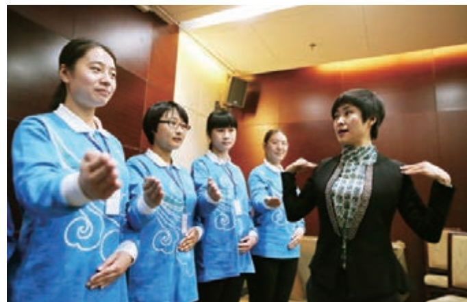
■服務APEC志願者在培訓