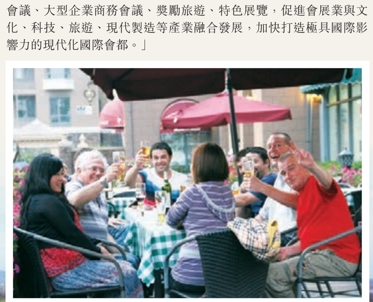
■外國友人歡聚懷柔風景小鎮