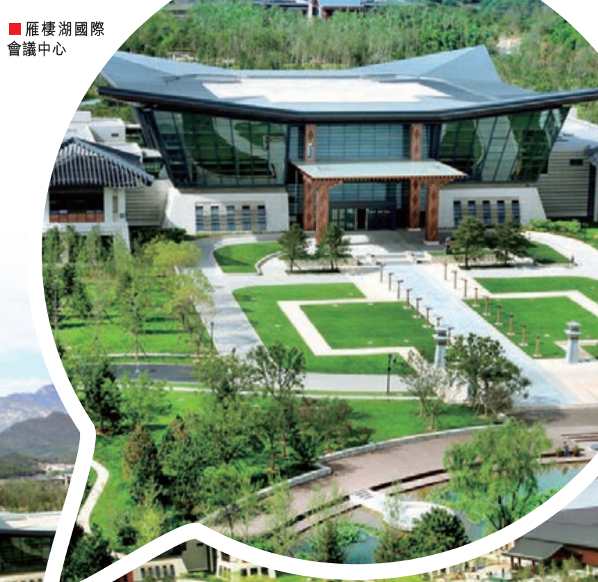
■雁棲湖國際會議中心