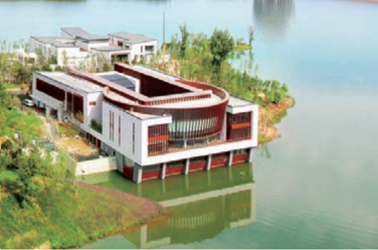
■雁棲湖國際會議中心全景