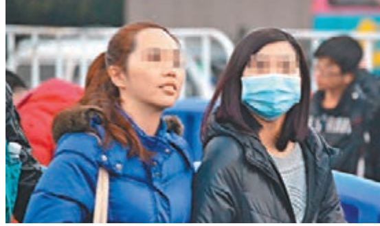
80後、90後「啃老」現象普遍。

近年來，部分80後、90後「啃老」成為一種社會現象，並屢屢引發熱議。對於「啃老」行為的看法，廣州社情民意研究中心在北上廣三大一線城市做的調查，列舉了四種「啃老」行為：「不工作仍由父母養」，同意的受訪者佔比高達88%；對「工作、結婚後仍跟父母住，但不給生活費」、「買房、買車、結婚等大開銷靠父母」，分別為67%和63%；而「讓父母帶孩子不給錢」，則佔52%。