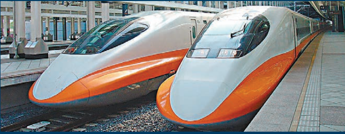
台灣高鐵明年3月面臨宣告破產，要由當局接管命運。網上圖片

香港文匯報訊 據中通社報導，在台灣高鐵因巨額債務而進入「破產倒計時」之際，台灣「交通部長」葉匡時前日表示，10天內如果財務改革方案無法在「立法院」過關，高鐵將面臨明年3月宣告破產，被當局接管的命運。