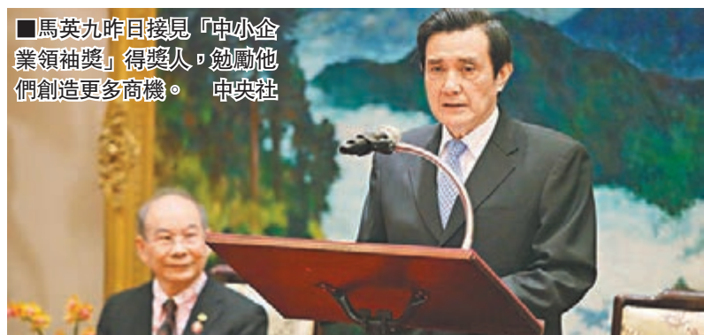
馬英九昨日接見「中小企業領袖獎」得獎人，勉勵他們創造更多商機。

香港文匯報訊 據中通社報導，馬英九昨日接見中小企業領袖時表示，台灣的企業98%都是中小企業，對於安定經濟有相當重要的作用，政府推動多項政策，包括兩岸經濟合作框架協議(ECFA)等，都是為協助中小企業發展，絕非獨厚大企業。