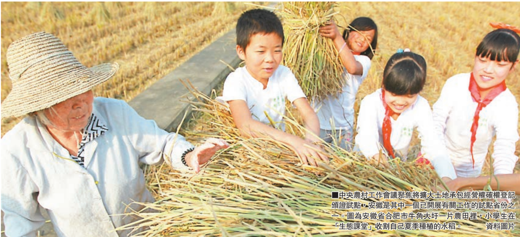
中央農村工作會議聚焦將擴大土地承包經營權確權登記頒證試點，安徽是其中一個已開展有關工作的試點省份之一。圖為安徽省合肥市牛角大圩一片農田裡，小學生在「生態課堂」收割自己夏季種植的水稻。資料圖片