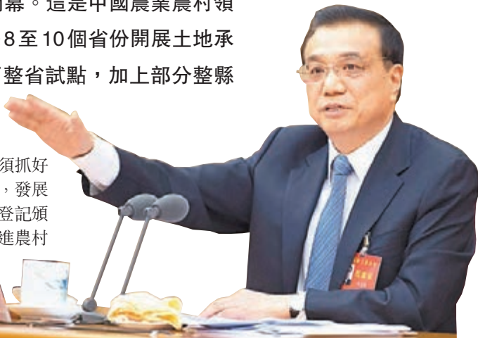
李克強出席中央農村工作會議並作重要講話。

禁在土地流轉中定任務、下指標、將流轉面積和比例納入績效考核。鼓勵發展多種形式的土地經營權流轉市場和服務平台，加強糾紛調解仲裁體系建設。出台管理文件，建立工商企業租賃農戶承包地的資格審查、項目審核和風險保障金制度，維護農民權益。