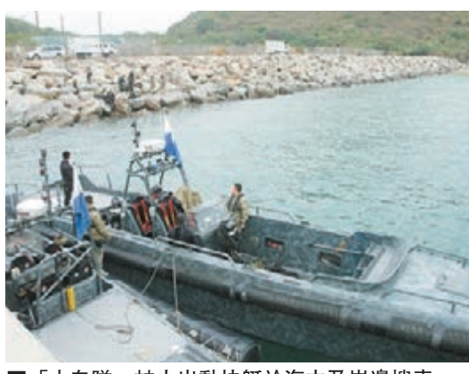
「水鬼隊」蛙人出動快艇於海中及岸邊搜索。

及至昨日早上9時許，警隊王牌「飛虎隊」中俗稱「水鬼隊」的蛙人奉召聯同水警人員合共約10人到場部署打撈，及至早上10時許，多名配備專業潛水裝備的「水鬼隊」隊員分乘兩艘快艇出海，其間除多次聯絡報案人，查問發現懷疑人骨位置，再潛入水底打撈外，又在附近水域搜索是否仍有其他證物，另外數名警員則在附近石灘戒備，防止閒雜人等接近。惟經長達6小時搜索，及至下午4時許，「水鬼隊」蛙人並無發現報案人所指的海底洞穴，於是收隊離開。