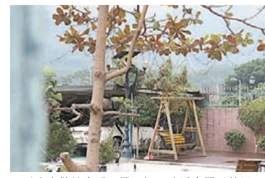
發生火警的車房可見一輛平治房車嚴重焚毀。的一部平治房車、一個雪櫃及大量雜物被燒毀，所幸無釀成傷亡。

昨日清晨6時27分，上址有蓋車位突然冒煙起火，53歲姓邱女住客發覺立即報警，惟在消防員到場前，車房已陷入一片火海。未幾，消防員接報到場馬上開喉灌救，並在上午7時04分將火救熄，惜有蓋車房已付諸一炬，停泊內