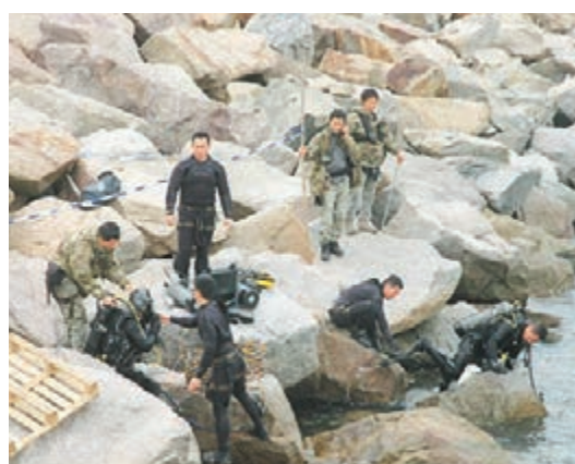
「水鬼隊」蛙人搜索後無發現。