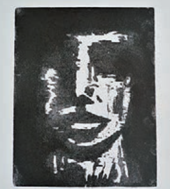
■Talking Head (2012)

林敬庭畢業於香港教育學院，主修視覺藝術教育。並於香港視覺藝術中心進修版畫創作。在學時期多次獲得文化與創意藝術學系獎學金。