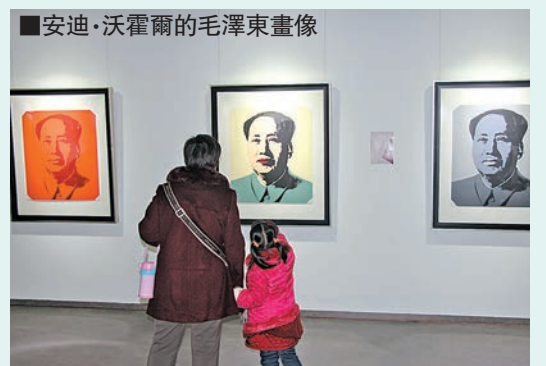
■安迪·沃霍爾的毛澤東畫像

香港文匯報訊(記者于永傑、實習記者趙銳山東報道)濟南西城·時光國際藝術館對外開放，該館首展「從文藝復興到畢加索」——歐美經典藝術