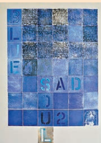
■ The Crosswords...just coz' of 08-14 "BLUE"(2014)