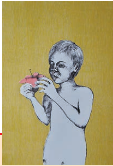
■I Need a Straw (2014)

繪畫的過程又同樣重要而且使我滿足。在兩者兼得的情況下，這個無水石版的方法對我來說仍然是一個合適的工具去創作。