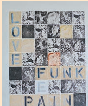
■ The Crosswords...just coz' of 08-14 "LOVE"(2014)

「Painting is my life. Paint with your soul & heart」。再次重燃生命中的目標，我總算可以有幸再次選擇人生，再次執起畫筆，從頭嚙過。過程真的十分痛苦，但我會珍惜這，no regrets!