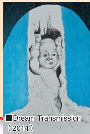
■Dream Transmission (2014)

至於黃曉楓的作品，她沒有製造意外，但卻從現成物(木版)的紋理之中發現若即若離的影像，也算是造物者給藝術家的意外驚喜。