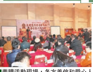
義購活動現場，各方善信和愛心人士濟濟一堂。

復建惠濟寺名家書畫慈善義購活動暨善心人士榮譽證書頒發儀式21日在南京舉行。當天，100多幅名家書畫作品全部被善心人士現場義購。此次活動歷經4個多月，共募集700多幅名家書畫籌得善款300多萬元。 位於南京浦口區的千年古刹惠濟寺始建於南朝，舊為湯泉禪院。咸豐年間，這座千年古刹毀於戰火，惠濟寺遺址現在為南京市級文物保護單位。目前，惠濟寺復建工作已啟動，建成後將成為內地少有、南京獨一無二的唐代風格古建築群，重現惠濟寺香火鼎盛的盛況。 記者 趙勇 南京報道