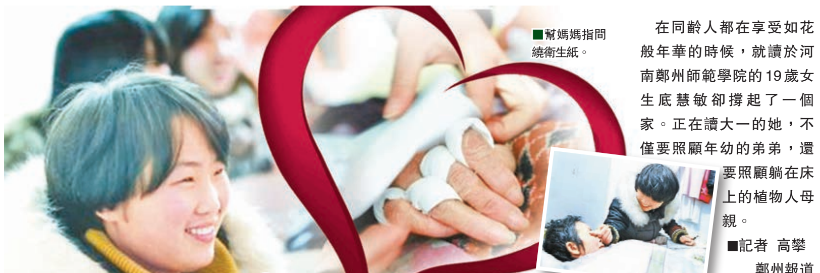
19歲的慧敏樂觀堅強。

香港文匯報訊（記者 蘇榕蓉 福州報道）記者22日從福建省公安邊防總隊獲悉，警方日前破獲一起越南轉道福建沿海偷渡台灣大案，共抓獲涉案人員31名，其中偷渡組織者、運送者4名（中國籍兩人、越南籍兩人），偷渡人員27名（均為越南籍，23男4女）。偷渡人員持護照或邊民證經廣西友誼關、東興口岸入境後，分批乘坐長途客車抵達福州、平潭集結。