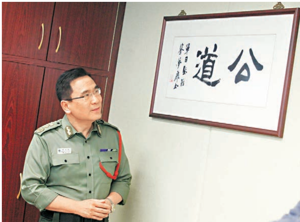
坦言日後不會從商，單日堅或改投青年義務工作，因堅持「知識可改變命運」，貫徹懲教宗旨。