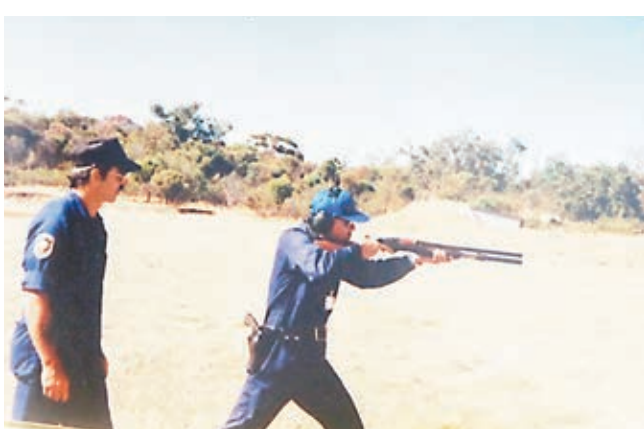
單日堅的珍藏舊照。