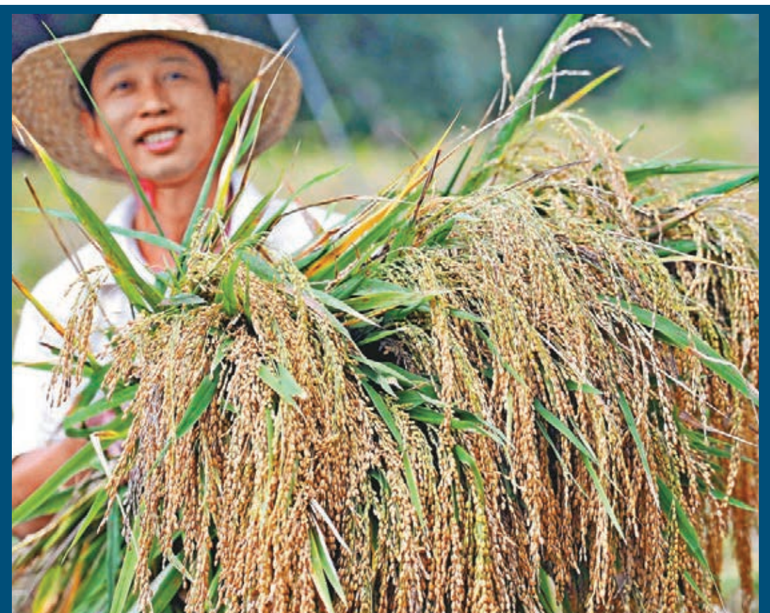
中央農村工作會議昨日在京召開，預計對加快轉變農業發展方式進行部署。圖為海南瓊中縣農民搶收山蘭稻。

目前中國農作物耕種收綜合機械化水平已超過60%，比10年前提高近30個百分點，但與發達國家仍有明顯