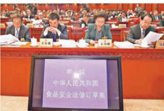
食品安全法修訂草案昨日第二次提交全國人大常委會審議，其中規定轉基因食品應當按照規定進行標識。

二審稿進一步加重食品安全違法行為的法律責任，如加重對添加藥品等四種違法行為的處罰，對用非食品原料生產食品等六種嚴重違法行為的責任人增加規定行政拘留的處罰。對明知從事違法食品