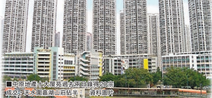
■中原地產十大屋苑過去兩日錄得20宗成交,天水圍嘉湖山莊佔半。資料圖片

買家均趁聖誕假期外出旅遊,以致二手市場交投氣氛放緩,屬意料之內,相信買家對後市態度樂觀,故本周成交量維持一定水平;一手市場上仍有不少新盤登場,買家亦需要時間消化。預料節日過後,購買力將重回二手市場,成交量有望回升。利嘉閣在剛過去的周末,十大指標屋苑二手成交錄得15宗,較上周有21%跌幅。位於港島區的康怡花園終止「三連蛋」的紀錄,剛過去的周末錄得3宗成交。