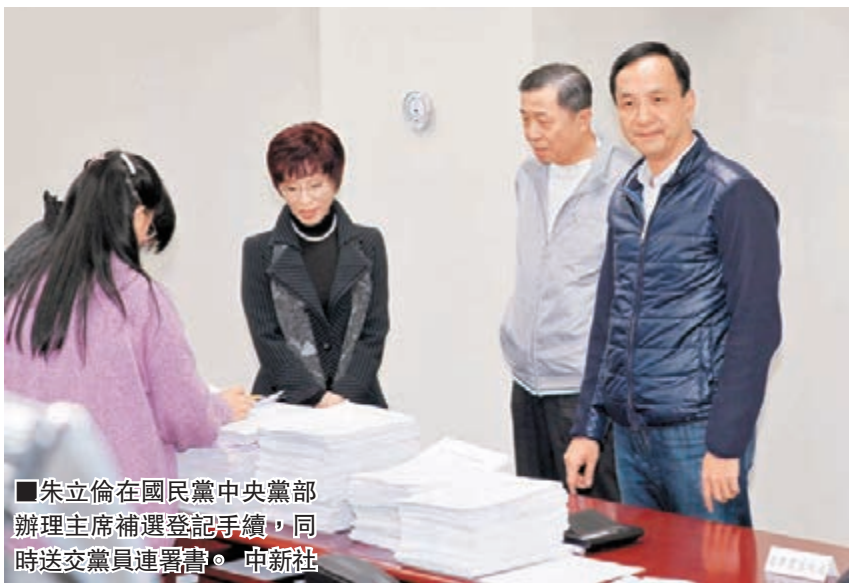
朱立倫在國民黨中央黨部辦理主席補選登記手續，同時送交黨員連署書。

現在還沒談到，等他1月17日選上黨主席再講。但朱立倫特別強調，兩岸關係必然要走向以和平、開放、互利的路線，不會改變，不論誰執政或是哪個政黨都一樣。國民黨長期以來推動兩岸和平開放互利，尤其是經濟發展，會重視公平分配。