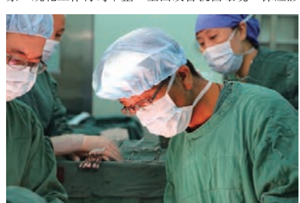
羅湖醫院腫瘤科手術。

醫患關係如何處理是公立醫院改革必須直面的問題，羅湖區人民醫院通過邀請協力廠商公司對醫院的醫療服務進行觀察暗訪，對個別護理人員態度冷淡、工作不主動等現象嚴加管理，在短時間內糾正不良現象，規範工作行為舉止，全面改善就醫環境。保證診