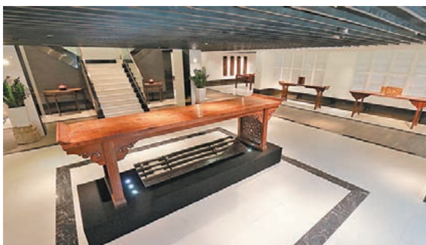
■博物館空間寬敞，兩層樓放置大概一百件展品。