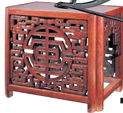
■紫檀嵌瘦木搖椅一對