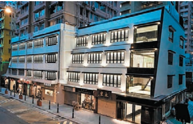
■兩依藏位於荷李活道古董街上，古董傢具得以「回家」。

開幕至今差不多十個月，每個月的人流不盡相同，二月開幕、五月巴塞爾藝術展、九月新展時人流特別多，其他時候都是散客為主，「我不想讓它變成一個鴨仔團，我希望每個人來到這裡會感到清淨，可以慢慢欣賞，而不是人頭湧湧甚麼都看不見，當然這也是因為我們不用搵錢，這差不多是丟錢入海的做法。」