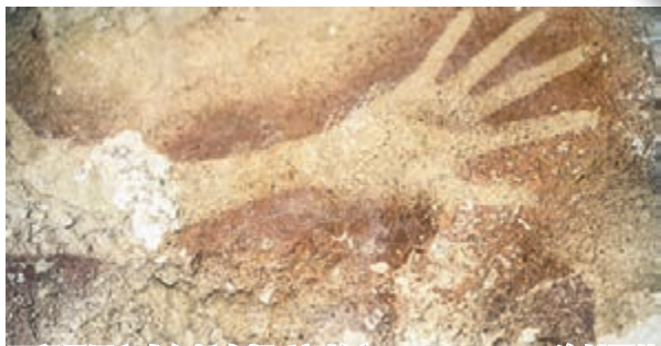
印尼洞穴畫包括人類手部輪廓。

另一項科學突破，是發現年輕血液有「返老還童」功效。科學家向高齡老鼠注入年輕老鼠的血液，令前者的肌肉及腦部重生，《科學》讚揚研究有助治療腦退化症。此外，印尼一個洞穴內的人手模印及動物圖案，此