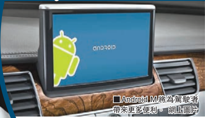
Android M將為駕駛者帶來更多便利。

Google今年推出可與智能手機連接的汽車作業系統Android Auto，消息人士透露，Google正研究在汽車內置可獨立運作的作業系統，無需連接手機，車主一上車，Google服務會自動啟動，並連接到網絡。