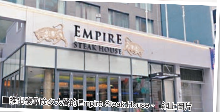
推出豪華除夕大餐的Empire Steak House。網上圖片

大除夕將至，紐約市高級牛排餐廳 Empire Steak House 推出非一般除夕大餐，選用最頂級的牛排和海鮮加以精巧烹調，還配上名貴餐酒，讓顧客體驗「帝王級」享受，但每位盛惠2.1萬美元(約16.3萬港元)，絕非人人花得起。