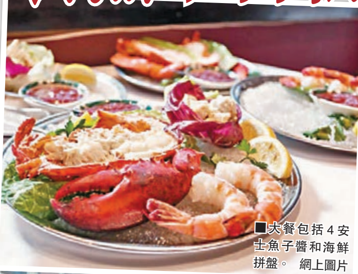
大餐包括4安士魚子醬和海鮮拼盤。

大餐前先奉上唐培里農粉紅香檳王，配以4安士魚子醬和海鮮拼盤；主菜為8安士A5級牛柳眼牛排，配上含白松露碎的馬鈴薯及黑松露忌廉菠菜，另配一瓶波得路堡紅酒；甜品為波得酒焗製的焦糖布丁和半瓶依肯酒。顧客用餐後，餐廳還會奉上波得酒和各式佐酒芝士。幸運的顧客還可獲贈1,000美元(約7,753港元)禮券，可於下次光顧時使用。若嫌大餐太昂貴，餐廳也提供較平民化的餐單，每位收費99美元(約767港元)。