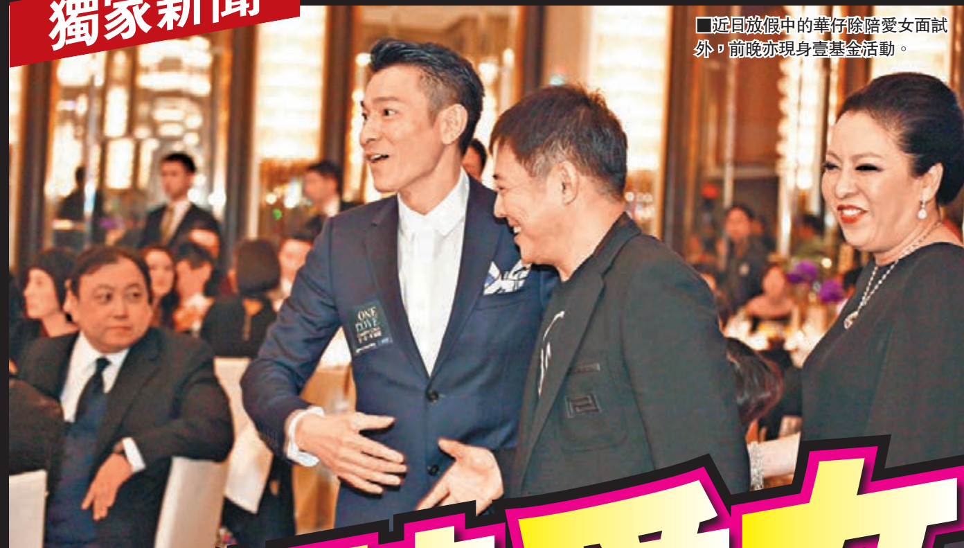
近日放假中的華仔陪陪愛女面試外，前晚亦現身壹基金活動。