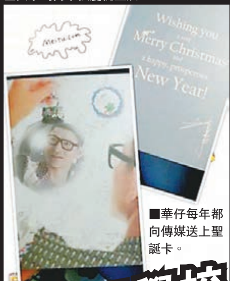
華仔每年都向傳媒送上聖誕卡。