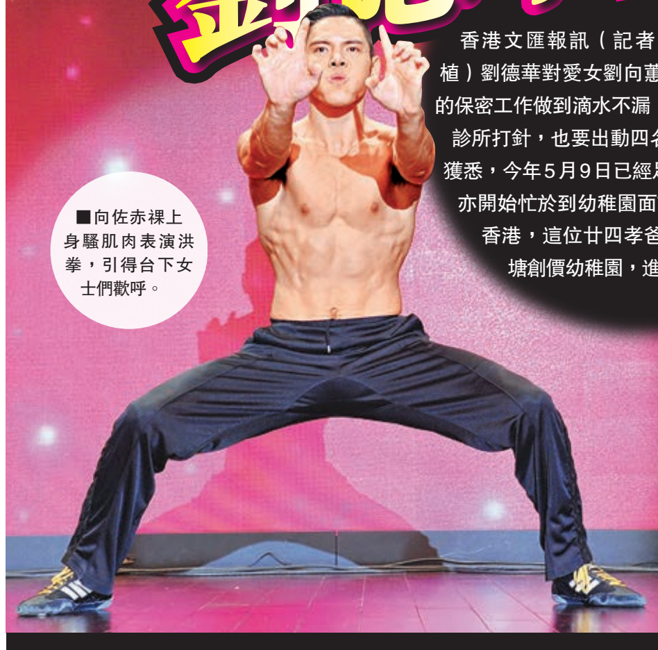
向佐赤膊上身騷肌肉表演洪拳，引得台下女士們歡呼。

至於李連杰創辦的壹基金前晚舉行慈善晚宴，席上亦有為理事向華強慶祝生辰，向生在台上切生日蛋糕時，不忘感謝朋友們如劉德華、李連杰及杜琪峯等出席支持活動，一班朋友均相識超過20年，前晚讓他過了一個難忘的生日。向生笑言已有十幾年沒大肆慶祝生日，今年生日能於慈善工作中度過分外感動，加上有太太及兩個兒子一家人齊齊共度，真的倍感高興。至於拍賣環節上，三十件珍貴拍賣品為壹基金共籌得2499萬。其中蕭敬騰更特別從台灣來港義務擔任表演嘉賓以作支持，向生亦慷慨出一百萬點唱一首歌，一共捐出了五百萬，蕭敬騰唱出的五首歌包括《Unchained Melody》及《我只在乎你》等，連同拍賣的二千多萬，前晚合共為「壹基金」籌得三千萬善款給予需要幫助的人士。另一位表演嘉賓是「壹基金」慈善大使向佐，他上台赤膊上身騷肌肉表演洪拳，引得台下女士們歡呼，更有女善長特別多捐五十萬支持向佐。至於向太前晚代兩位朋友，分別以七十七萬元投得一塊沉香，以及三十五萬投得銀壺。另，近日榮升「亞洲首富」的馬雲以七百萬投得一塊翡翠。