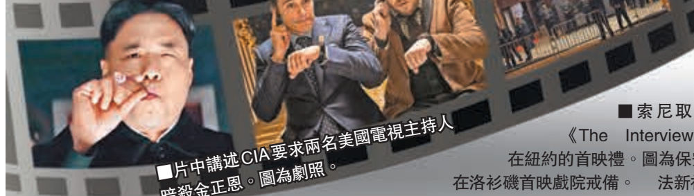
片中講述CIA要求兩名美國電視主持人暗殺金正恩。圖為劇照。