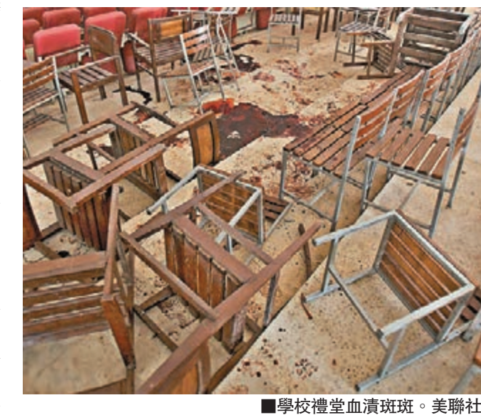
學校禮堂血漬斑斑。美聯社

澳洲總理阿博特昨日透露，悉尼挾持人質案槍手莫尼斯曾於2008至2009年被當局列入恐怖分子監察名單，但數年前因不明原因被剔除。外界質疑澳洲情報部門反恐不力，阿博特承諾徹查漏洞，確保國民安全，最快下月提交報告。 莫尼斯有多次暴力及精神不穩前科，加上曾於互聯網散播極端思想，引起澳洲警察及情報機關注意，但卻未有列入監察名單，最終釀成悲劇。阿博特形容莫尼斯是瘋子，不明白他沒被嚴密監控原因何在。 【法新社/美聯社/路透社