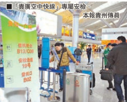
「貴廣空中快線」專屬安檢。

此次開通的「空中快線」,重點通過設置5項專屬「特權」,提升登機速度。分別是:設置專屬機位、登機口,在航班保障不衝突的情況下,原則上均使用離安檢口最近的登機口為廣州航班專用機位;設立2個專屬值機櫃檯;設立專屬安檢通道;設立專用行李滑槽及行李提取轉盤,對廣州航班行李實行行李滑槽自動優先分配;對「貴廣空中快線」旅客實行「苗姑娘導乘」專人引導機制。