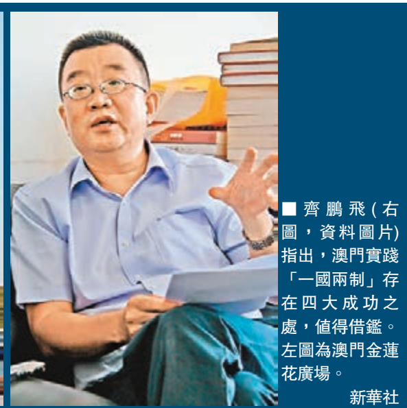
■齊鵬飛(右圖,資料圖片)指出,澳門實踐「一國兩制」存在四大成功之處,值得借鑒。左圖為澳門金蓮花廣場。

香港文匯報訊(記者 馬靜 北京報道)被譽為「東方寶石」的澳門即將迎來回歸十五周年盛事。總結澳門15年「一國兩制」實踐歷程,全國港澳研究會副會長、人民大學港澳研究中心主任齊鵬飛認為,澳門已經成為中國推行「和平統一、一國兩制」的試驗田和參考樣板。他特別指出澳門實踐「一國兩制」存在四大成功之處,值得借鑒。