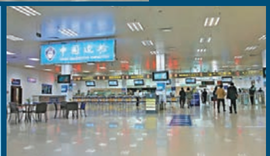
■橫琴口岸入境大廳。