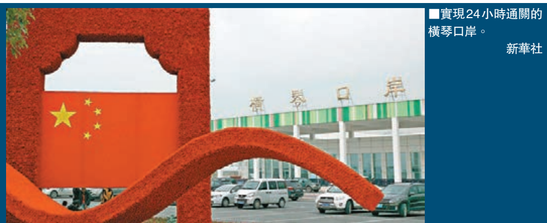
■實現24小時通關的橫琴口岸。 新華社