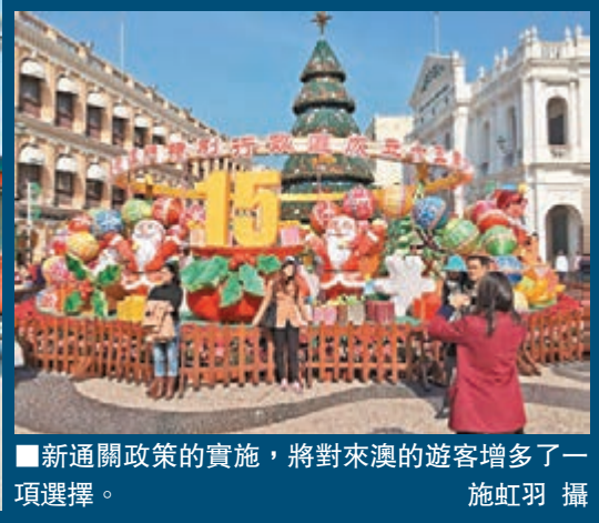
■新通關政策的實施,將對來澳的遊客增多了一項選擇。