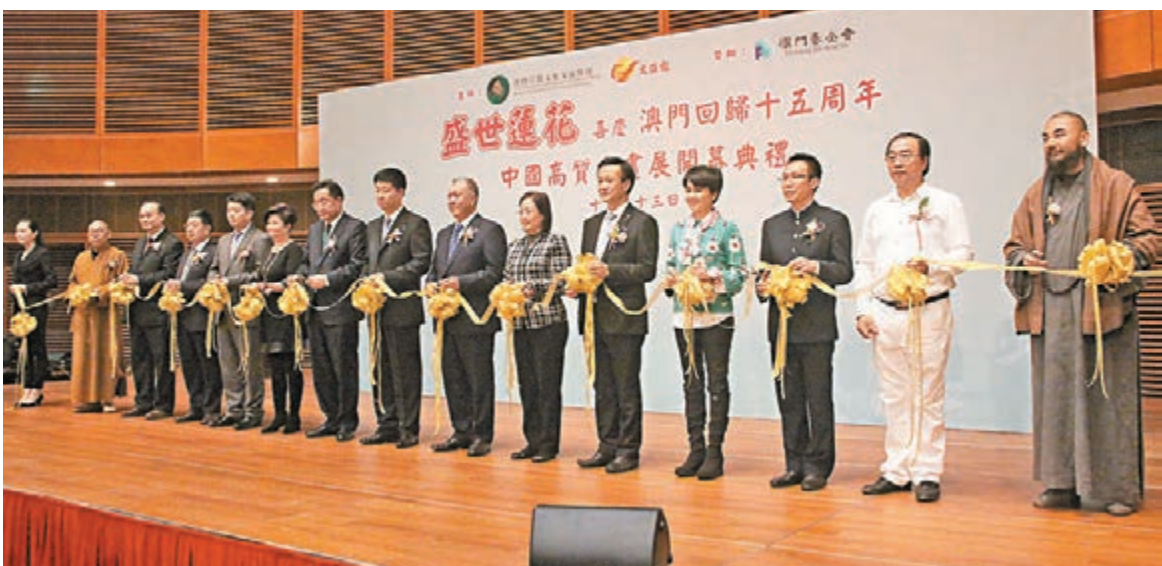
■書畫展於本月13日在澳門科學館開幕,由全國政協副主席何厚錕、香港文匯報副社長馮瑛冰等主禮剪綵。 本報記者澳門傳真