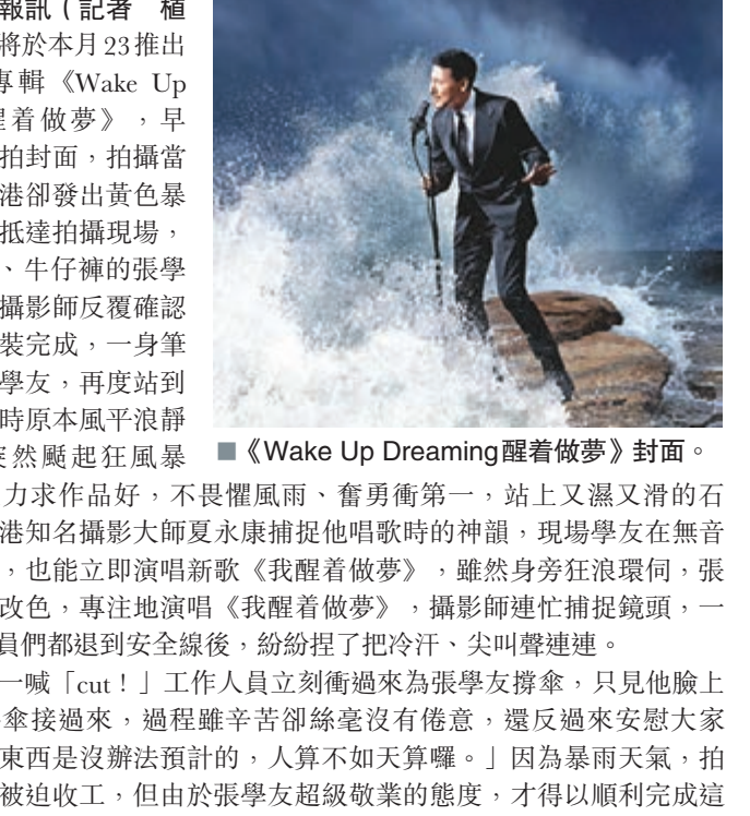
《Wake Up Dreaming 醒着做夢》封面。

香港文匯報訊(記者 植植)張學友將於本月23推出全新國語專輯《Wake Up Dreaming 醒着做夢》,早前他為專輯拍封面,拍攝當天早上,香港卻發出黃色暴雨警告,一抵達拍攝現場,身穿T-shirt、牛仔褲的張學友,立刻跟攝影師反覆確認定位,當着裝完成,一身筆挺西裝的張學友,再度站到石岸邊,此時原本風平浪靜的海岸,突然颶起狂風暴雨,張學友力求作品好,不畏懼風雨、奮勇衝第一,站上又濕又滑的石岸,為讓香港知名攝影大師夏永康捕捉他唱歌時的神韻,現場學友在無音樂的情況下,也能立即演唱新歌《我醒着做夢》,雖然身旁狂浪環伺,張學友仍面不改色,專注地演唱《我醒着做夢》,攝影師連忙捕捉鏡頭,一旁的工作人員們都退到安全線後,紛紛捏了把冷汗、尖叫聲連連。 當攝影師一喊「cut!」工作人員立刻衝過來為張學友撐傘,只見他臉上帶着笑意將傘接過來,過程雖辛苦卻絲毫沒有倦意,還反過來安慰大家說:「有些東西是沒辦法預計的,人算不如天算囉。」因為暴雨天氣,拍攝一小時便被迫收工,但由於張學友超級敬業的態度,才得以順利完成這張波瀾壯闊的精彩封面。