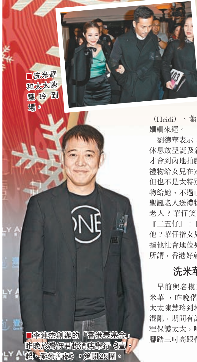
李連杰創辦的「香港壹基金」昨晚於灣仔君悅酒店舉行《壹·起·愛慈善夜》，筵開25圍。