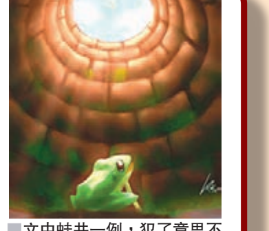
文中蛙井一例，犯了意思不完整這毛病。網上圖片

圖丁 作者簡介：現職中文教師，大學畢業之後，全程投入教育事業之中，一晃眼30多年。如命之後，回歸中國文化；躬耕校園一隅，推廣儒道，自得其樂。