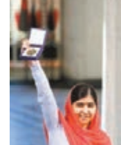
馬拉上月獲和平獎。

在襲擊前幾天，塔利班曾警告，馬拉與西方邪惡勢力達成協議，諾貝爾委員會向她頒獎是為了「宣揚西方文化，而不是教育」。