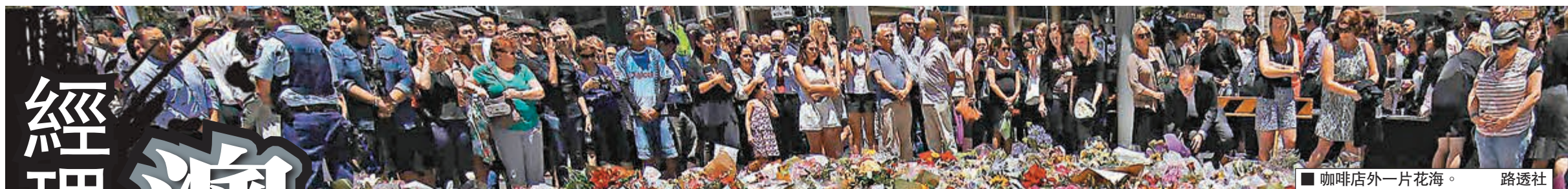
咖啡店外一片花海。