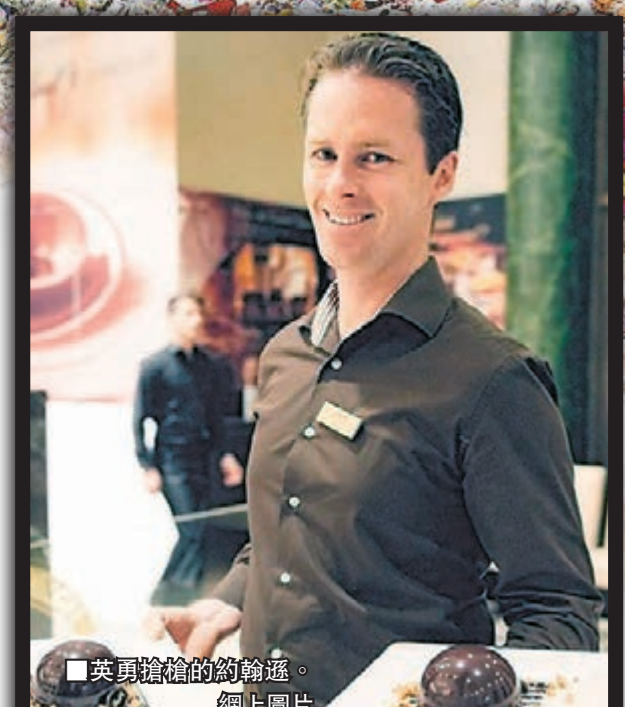
英勇搶槍的約翰遜。