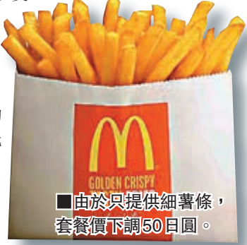
■由於只提供細薯條，套餐價下調50日圓。