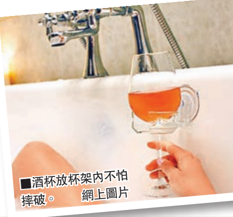
■酒杯放杯架內不怕摔破。網上圖片

杯架的網站提醒，用家把容器放上杯架前，應先確保它已穩固貼在牆身，並建議杯架最好貼在玻璃表面，貼前先濕潤吸管，可令杯架更穩固。■《每日郵報》