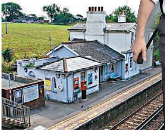
7.2英鎊(約87.6港元)車資，而非原價21.5英鎊(約261.7港元)的全額車資。