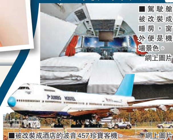
■被改裝成酒店的波音457珍寶客機。

曾有人將飛機改裝成住宅，但並非人人有能力這樣做。瑞典企業家迪奧斯豪花150萬英鎊(約1,821萬港元)，把一架退役波音457珍寶客機改裝成酒店，每晚房價320英鎊(約3,885港元)。飛機酒店位處瑞典斯德哥爾摩阿蘭達機場65呎外，住客可欣賞到飛機升降的情景。客機是泛美航空退役機，全機可容納450名乘客，於1984年至1991年期間提供客運服務。飛機改裝後設有33間房，最豪華的客房設在駕駛艙，配備獨立廁所。旅客亦可移步至酒吧間，一邊坐客機扶手椅，一邊吸飲馬尼，寫意盡興。■綜合報道