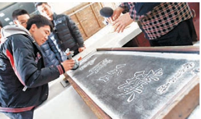
北京展區額 區額拓片北京高校巡展昨日來到北京電子科技職業學院圖書館,展品均來自北京科舉區額博物館。作為集書法篆刻和建築藝術為一體的文化形式,區額是當下人們了解中華文化的重要實物例證,學生們在感受中華書法藝術魅力的同時,可以得到來自真正傳統文化的陶冶和熏陶。

上海 香港文匯報訊(記者 倪夢瑋 上海報導)知識改變命運,為幫助貧困家庭學子獲得更多學習機會、改善生活,上海第二十一屆「藍天下之至愛」系列慈善活動之一的「愛我中華」慈善教育專項基金捐助儀式暨「知識改變命運」大型慈善報告會,近日在上海煙草集團公司舉行。上海市一千名品學兼優但家庭貧困的大、中學生獲得了由中華慈善教育基金會頒發的300萬元人民幣助學金。為充實「愛我中華」慈善教育專項基金,上海煙草集團公司向上海市慈善基金會捐贈一千萬元人民幣。