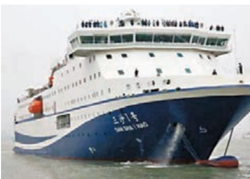
大型交通補給船「三沙1號」。

據悉,「三沙1號」輪於12月6日上午從遼寧葫蘆島碼頭出發,於11日上午駛入海口港,該交通補給船是在三沙建市後專為三沙量身製造,先進的設計理念和設備配置能更好地滿足三沙建設發展需求。「三沙1號」排水量7,800噸,設計航速每小時19海里,可搭載旅客456人,裝載20輛標準集裝箱車,具有全天候航行的良好穩定性和舒適性,可保證船舶在8級風條件下正常航行,10級風條件下船舶安全。