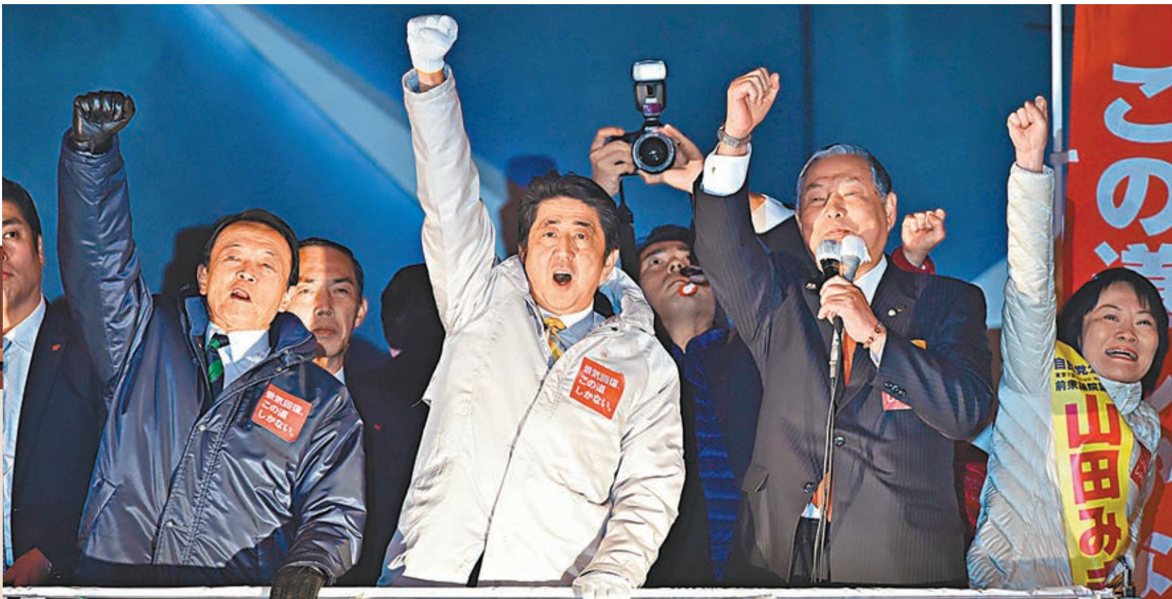
■安倍(前左三)連同副首相兼財相麻生太郎(前左一)為黨員拉票，作最後衝刺。

日本今日舉行大選，民調顯示首相安倍晉三率領的自民黨勝望甚高，可望取得逾2/3眾議院議席，繼續推行「安倍經濟學」和其他一系列外交內政。不過分析指，這絕非自民黨表現佳，只是在野民主黨太不濟，令選民在一堆「爛橙」中揀無可揀，安倍才有機會連任。《紐約時報》形容，即使安倍當選，也只是一種「空洞的勝利」。