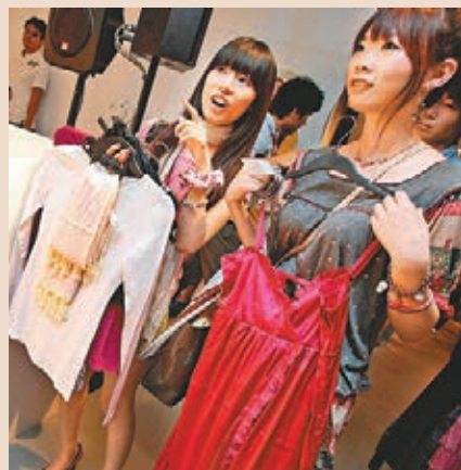
■安倍再任首相後提出以「三支箭」刺激經濟。資料圖片

日本過去20多年增長長期停滯，安倍晉三前年再任首相後，提出以「三支箭」重振增長，分別是增加政府開支、寬鬆貨幣政策及經濟結構改革，前兩者已登場，關鍵的結構改革「第三支箭」卻一直未見蹤影。