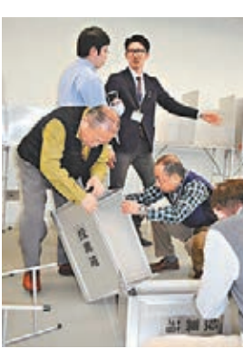
■票站職員準備票箱。

根據日內瓦國會議員聯盟(IPU)制訂的排名，日本國會女性議員人數比例在189個國家中排第129，連風氣保守的沙特阿拉伯亦較日本高12個百分點。 ■英國廣播公司/法新社/《衛報》