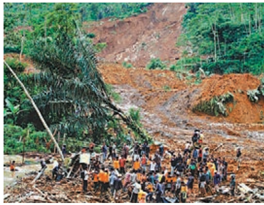
山泥沖毀逾百間房屋，大批救援人員到場搜救。