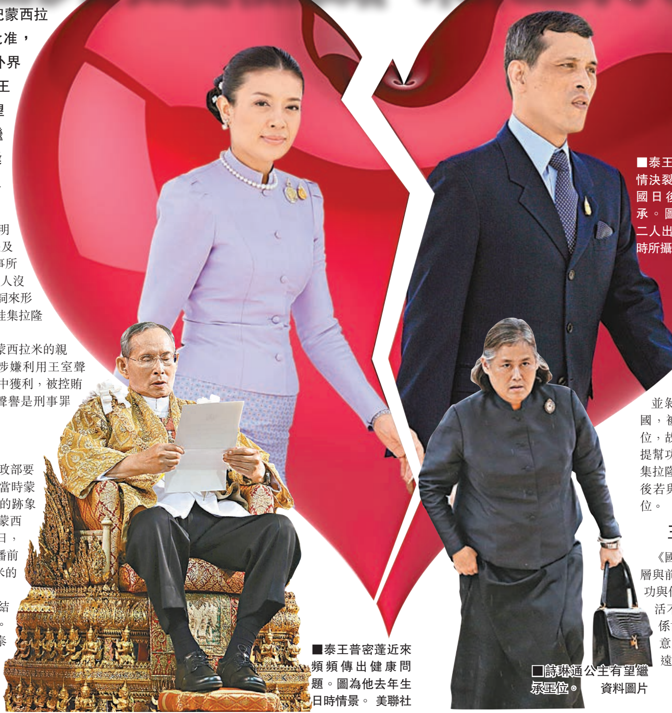
泰王普密蓬近來頻頻傳出健康問題。圖為他去年生日時情景。