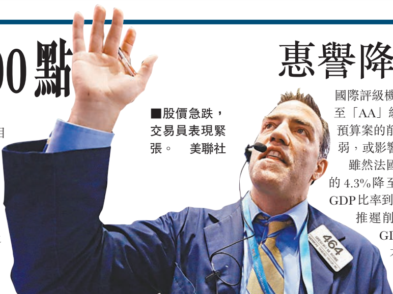
股價急跌，交易員表現緊張。