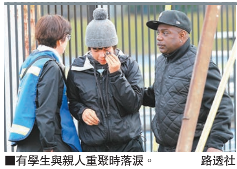
■有學生與親人重聚時落淚。

美國俄勒岡州波特蘭市一所高中前日發生槍擊案，造成4人受傷，其中3人傷勢嚴重，槍手逃去無蹤，警方展開大規模搜索。