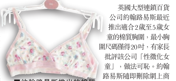
■約翰路易斯推出的棉質胸圍。網上圖片

英國大型連鎖百貨公司約翰路易斯最近推出適合2歲至5歲女童的棉質胸圍，最小胸圍尺碼僅得20吋，有家長批評該公司「性徵化女童」，做法可恥。約翰路易斯隨即刪除網上商店的有關廣告，並更正指該款胸圍適合11歲以上女童穿着。