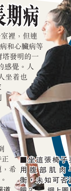
■坐這張椅子要用腹部肌肉平衡，未知可否減肥？