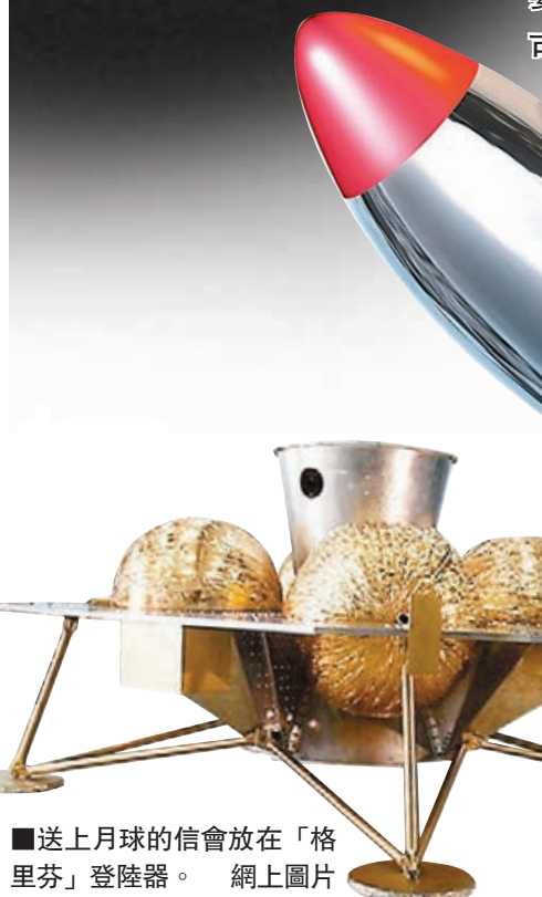
■送上月球的信會放在「格里芬」登陸器。