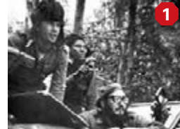
卡斯特羅(右)當年視察軍情。

1960年代過後，美國轉而利用商業、經濟及金融方面的禁運打擊古巴，但近年被揭發由美國國際開發署(USAID)秘密顛覆古巴政權，包括在古巴創立被稱為「古巴twitter」的「ZunZuneo」社交網絡，散播異見訊息，更嘗試拉攏twitter共同創辦人多爾西合作，但最終因資金不足而放棄。