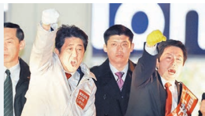
大選在即，安倍為黨員(右)拉票。