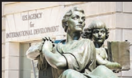
USAID工作範圍覆蓋全球。網上圖片

美國國際開發署(USAID)於1961年成立，工作範圍覆蓋全球，在華府對外政策上扮演重要角色。USAID聲稱工作目標是要結束極端貧窮及建設民主社會等，但被指其實是以滲透式宣傳手段「推動民主」，造成其他國家政局動盪，引起多國不滿，更損害美國外交形象。