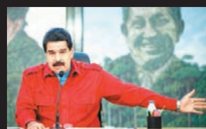
馬杜羅批評美國制裁瘋狂。

委國民眾今年2月因不滿食物及基本生活用品短缺、高通脹等社會問題，發起大規模示威要求馬杜羅下台，多次演變成