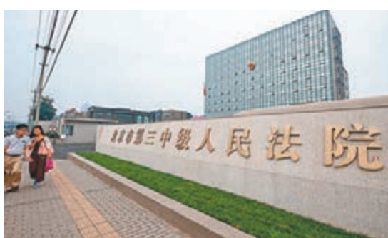
北京將於本月底成立第四中級人民法院，跨行政區劃審理重大案件。圖為北京第三中級人民法院。