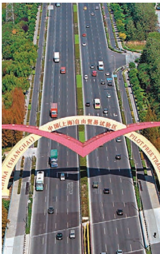
國務院常務會議部署推廣上海自貿區試點經驗。資料圖片

值得一提的是，脫胎於上海自貿區的各項改革均秉承「可複製，可推廣」的原則。據統計，目前已有27項制度創新成果在全國或部分地區推廣，20多項比較成熟的經驗正被加速複製。據商務部透露，下一步還將有18項改革措施、5項開放措施在全國推廣，包括允許設立外商股份制外資投資性公司、允許內外資企業從事遊戲遊藝設備生產和銷售等。