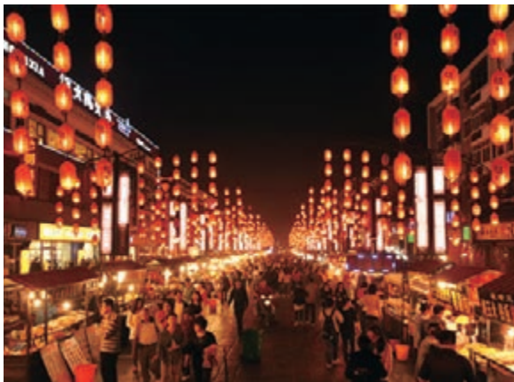
■ 洛陽老城十字街。

據了解，從2002年啟動文明城市創建工作至今，洛陽市一直把「富民、惠民、利民」作為創建全國文明城市的基本理念，並鼓勵市民積極參與，實現政府與市民的良好互動，使公民意識與城市文明一起成長，人民的生活幸福指數逐年提高。洛陽市瀕西區重慶路轄區內群眾自發組織開展的「鄰居節」、「百家宴」等活動，成為洛陽市創建全國文明城市活動的縮影。每年洛陽市都會湧現出一批好人好事，洛陽市13歲少年張俊被授予2014全國「最美孝心少年」稱號，洛陽老城區環衛工人郭春梅19年如一日的裝扮洛陽城榮獲「全國優秀環衛工人」稱號，72歲洛陽老漢王月申打工20年替子還債被譽為「誠信老人」等等，都在向社會傳遞著正能量，彰顯着洛陽文明城市的「力量」。