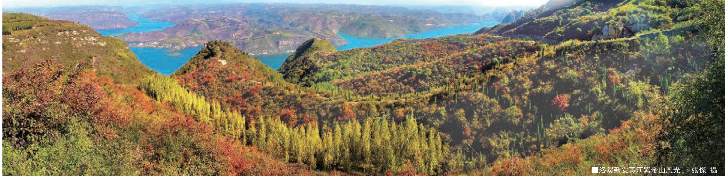
■ 洛陽新安黃河紫金山風光。張傑 攝