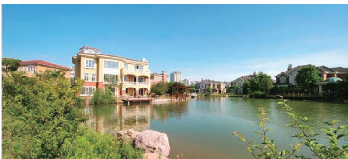
■ 洛陽新區居民社區。

與國內許多城市一樣，洛陽市仍面臨着城市次幹路與支路數量偏少等問題，道路網等級結構仍不盡合理。洛陽市住建委負責人表示，缺乏次幹路，交通生