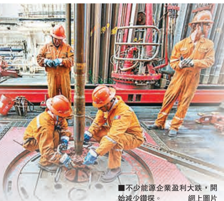
不少能源企業盈利大跌, 開始減少鑽探。

油價大跌的影響波及全球金融市場, 加拿大股市前日跌至2月以來低位, 新興市場股市創8個月新低。投資者幾乎肯定委內瑞拉會陷入違約, 當地國債價格跌至16年低位, 信貸違約掉期(CDS)成本創新高。其他商品價格亦受衝擊, 銅價和金價分別跌1.2%和0.2%。