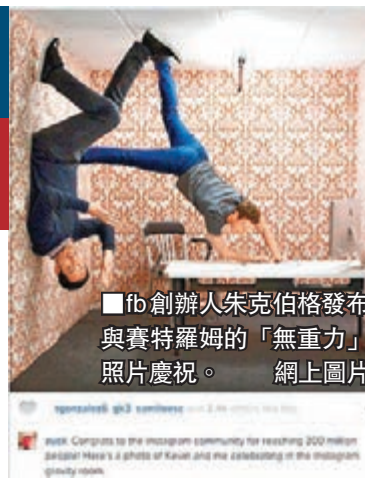
fb創辦人朱克伯格發布與賽特羅姆的「無重力」照片慶祝。