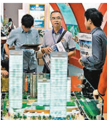
穗部分開發商年底促銷忙。

香港文匯報訊(記者古寧廣州報道)受內地放鬆房貸利好影響,雖臨年底,傳統的「金九銀十」旺季已過,但廣州樓市新項目入市的腳步並沒有停。記者了解到,穗開發商在傳統銷售旺季之後,仍大舉促銷沖量。根據網易房產最新統計,12月廣州樓市預計有63盤推新,再掀推貨小高潮。業界人士則預期,開發商未達成銷售目標前,暫難升價。