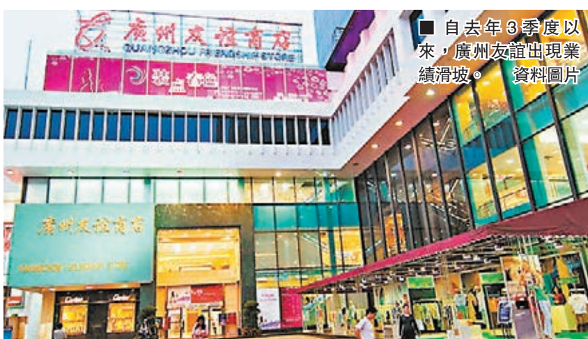
自去年3季度以來,廣州友誼出現業績滑坡。

據介紹,越秀金控是在港註冊的越秀集團「地產、金融、交通」三大板塊的重要一環,業務涵蓋證券、期貨、基金、融資租賃、創投、擔保、小貸等。此前越秀集團收購的港創興銀行(1111)也併入越秀金控麾下。據稱,注入到上市平台後,越秀金控將發揮資本市場的融資優勢,加強金