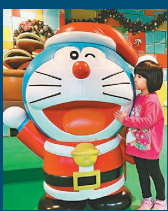
■人氣卡通人物多啦A夢現身海園吸客。

同時,深受廣大市民歡迎的卡通人物多啦A夢今次首次與大雄、靜香等以不同的聖誕造型,與遊人見面。他們會在威威天地的「多啦A夢神奇聖誕屋」中,鬼馬地躲藏不同角落,讓遊人與他們合照留念。